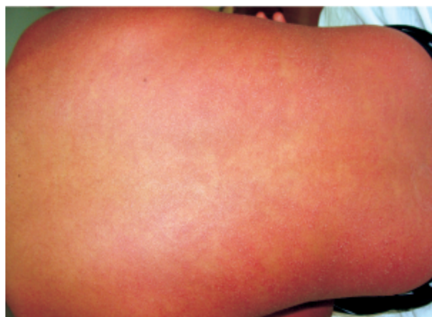
Figura 5. Caso 2: Pústulas milimétricas sobre eritema difuso en tronco.

Evolución: El paciente presenta desaparición progresiva de las pústulas y el eritema con descamación e hiperpigmentación residual y al 11° día de enfermedad se produce el cese de la fiebre.