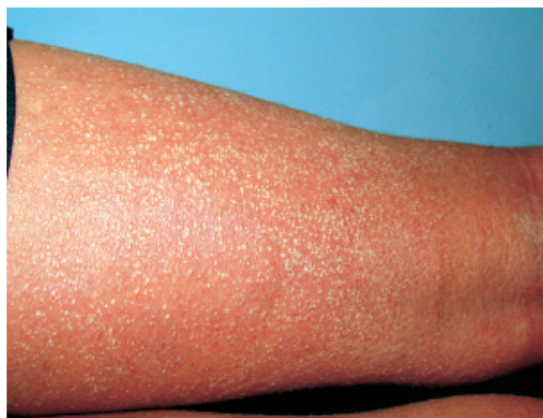
Figura 6. Caso 2: Reguero de pústulas sobre eritema difuso en muslo.

Figura 5. Caso 2: Pústulas milimétricas sobre eritema difuso en tronco.