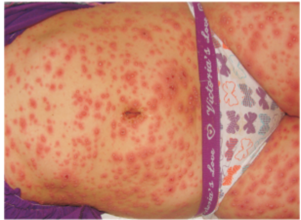
Figura 1. Caso 1: Pústulas sobre base eritemato-edematosas, diseminadas a tronco y miembros.

En rostro inyección conjuntival, mucosa labial con costras ( Figura 3 ). Respeto cuero cabelludo.