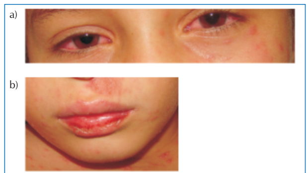
Figura 3. Caso 1: a) Inyección conjuntival, b) mucosa labial con costras.

Laboratorio: Hemograma con leucocitosis y neutrofilia. PCR positiva. Perfil renal y hepático en rango. Citodiagnóstico de Tzanck negativo. Frotis y cultivo de la pústula negativo para gérmenes comunes y BAAR. Colagenograma en rango normal. Serología para CMV, VHS, Rubeola, Toxoplasmosis, VDRL negativos.