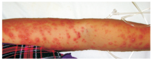
Figura 2. Caso 1: Iguales lesiones en miembro superior.