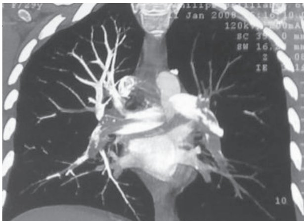
Fig. 1. Tomografía multicorte con imagen de trombo en el tronco y las ramas principales de la arteria pulmonar.

Consultó por dolor precordial opresivo asociado con disnea progresiva de tres semanas de evolución. Se encontraba