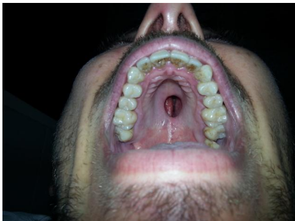
Figura 1. Lesión de paladar.

nasotraqueal, efectuamos una resección de los tejidos perilesionales y tallamos un colgajo mucoperióstico de paladar peri orificial, según técnica tipo Rintala (figura 2a) y luego tallamos otro colgajo mucoperióstico del sector palatino contralateral, con pedículo vascular en la arteria palatina posterior, tipo Randal (figura 2b). El colgajo peri orificial se desplazó y se rotó de manera que la mucosa palatina pasara a localizarse en el piso nasal, se fijó con puntos, posteriormente se reforzó con una malla de colágeno bovino que también fijamos (figura 2c) y todo el orificio se cubrió con el segundo colgajo en forma de raqueta, que una vez desplazado y rotado, también se fijó con puntos separados de material absorbible (figura 2d). La superficie cruenta ósea del lecho dador cerró por segunda intención en 15 días. La evolución fue favorable, no presentando morbilidad por el procedimiento (figura 2e). Continuó en buena evolución hasta el último control a los seis meses, luego recayó en el consumo de droga, negado por él pero manifestado por los familiares