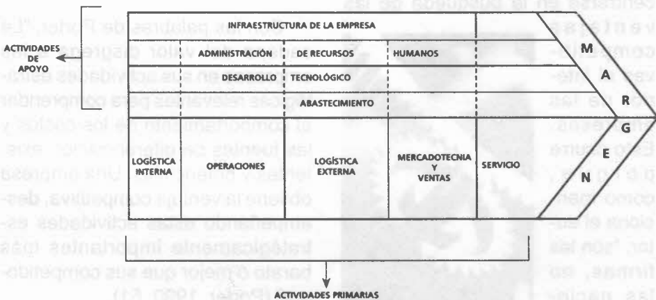
Figura 1 Cadena de valor

Es importante resaltar que la cadena del valor no consiste en un conjunto de actividades aglomeradas, sino en un sistema de actividades interdependientes. Dichas actividades están relacionadas por eslabones dentro de la cadena del valor de la empresa (eslabones "horizontales") y por eslabones