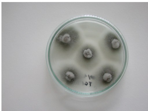
Figura 2. Aislamientos de Colletotrichum sp provenientes de cultivos de mora, cultivados en medio PDA

Posteriormente, para obtener cultivos monospóricos, con un sacabocados se tomaron esporas del aislamiento puro y se sembraron por agotamiento en tubos de ensayo con medio PDA (Figura 3).