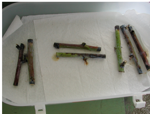
Figura 4. Método de punción de estacas

En todos los tratamientos se hicieron controles con material vegetal con y sin herida, asperjados solo con agua estéril. Los cuatro tratamientos fueron puestos en cámara húmeda a 23 °C, bajo condiciones de oscuridad durante 15 días.