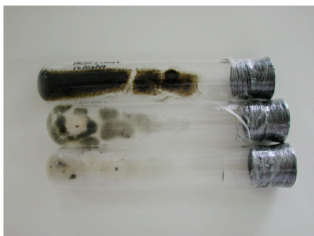
Figura 3. Crecimiento del hongo por agotamiento

Los tubos fueron puestos en incubadora a 23°C en completa oscuridad.