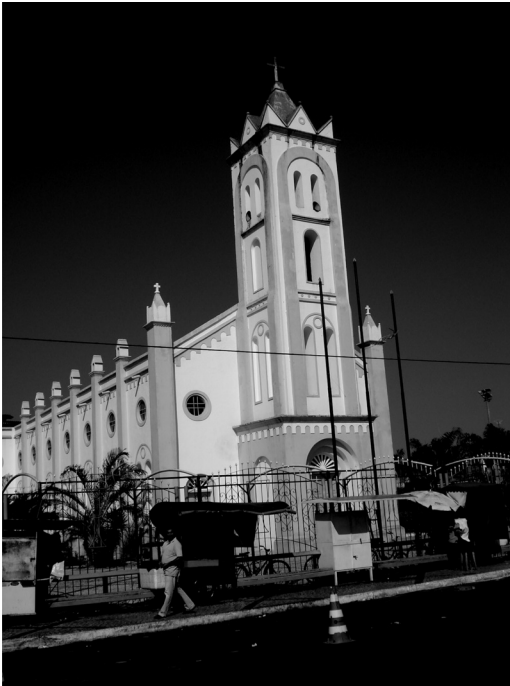
Figura 02 – Igreja Matriz do município de Pacajus, demonstrando a existência de vários ambulantes ao seu redor.

Enfim, o quadro retratado por este artigo representa a expressão de fenômenos territoriais e geográficos da dinâmica do trabalho submetida aos ditames do capital.