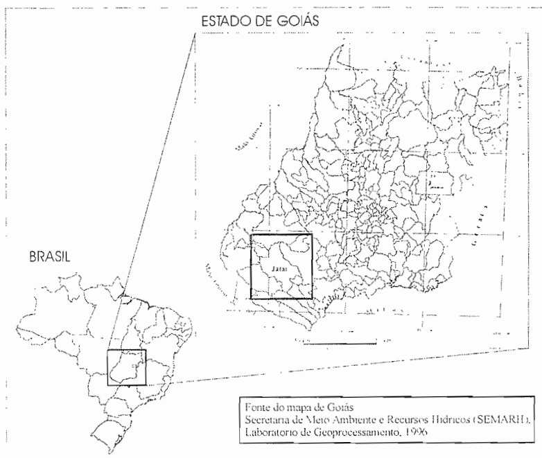
Figura 2 – Localização do Município de Jataí-GO

Pode-se argumentar a favor da modernização das atividades produtivas quando se observa que o ambiente do cerrado jataiense é francamente favorável ao uso de certas técnicas, como a mecanização das etapas de plantio e colheita de lavouras.