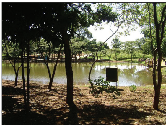
Figura 7 - Área Interna do Parque Fonte Nova, entre os bairros Vila Finsocial e Jardim Fonte Nova

A acessibilidade das comunidades da região periférica a esses parques é difícil, uma vez que é preciso se locomover de seus bairros, por meio do transporte público, em busca de lazer em pontos com melhor qualidade. Já os parques situados em bairros populares, com tanta debilidade em infraestrutura – faltam iluminação e segurança pública, os equipamentos do parque infantil são insuficientes, a água do lago não é tratada –, não atendem as necessidades de lazer ou bem-estar social aos seus frequentadores.