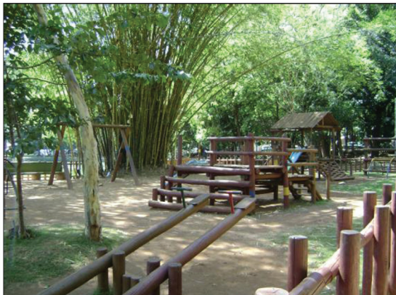
Figura 3 - Parque Infantil - Bosque dos Buritis, Região Central de Goiânia Fonte: Foto de Jorgeanny de Fátima R. Moreira (janeiro 2010).