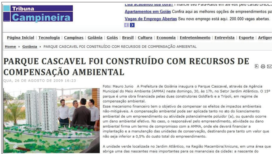
FIGURA 1 - Construtoras investem na implantação do Parque Cascavel para a valorização das áreas construídas.