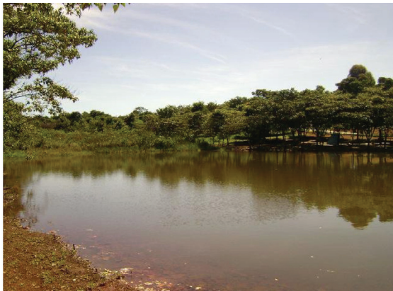
Figura 9 - Lago do Parque Fonte Nova. Região Noroeste de Goiânia

Fonte: Foto de Jorgeanny de Fátima R. Moreira (janeiro 2010).