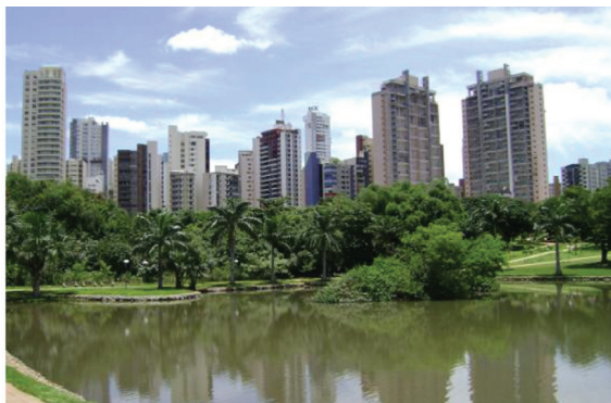
Figura 6 - Lago do Parque Vaca Brava (dois prédios em construção)