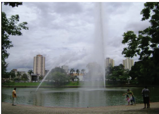
Figura 4 - Fonte com jato de água medindo 40 metros de altura - Bosque dos Buritis

O parque 11 (Botafogo) localiza-se entre os setores Central, Vila Nova e Leste Universitário. Ele abriga o principal centro de diversão da capital (Parque Mutirama) e fica próximo a universidades e escolas particulares de ensino básico. O parque 8 (Lago das Rosas) fica localizado no Setor Oeste, nas proximidades do Setor Aeroporto. É um dos parques mais antigos da cidade e fica próximo ao Zoológico de Goiânia. É próximo a