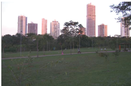
Figura 5 - Pista de Cooper interna e prédios em construção - Parque Flamboyant

O Parque Vaca Brava (79.890,63 m 2 ) e o Parque Flamboyant (130.000,00 m 2 ) são exemplos de áreas que recebem atenção especial da administração pública. O primeiro está localizado no Setor Bueno, um dos bairros mais nobres da capital; já o segundo localiza-se no Jardim Goiás, onde se concentram os principais investimentos das construtoras. Além disso, ambos estão próximos aos dois maiores shopping centers de Goiânia, portanto, o fluxo de visitação é sempre alto.