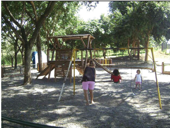
Figura 8 - Área Interna do Parque Fonte Nova, entre os bairros Vila Finsocial e Jardim Fonte Nova