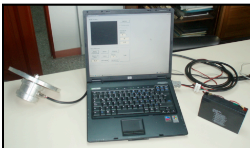
Figura 3 Conjunto de elementos que conforman la adquisición de datos

En la figura 3 se ilustra el conjunto de elementos que conforman la adquisición de datos, a la izquierda se observa la quinta rueda, con su correspondiente cable para la interfase al computador y a la batería de alimentación. La batería alimenta los instrumentos de la configuración electrónica de la quinta rueda, y garantiza que siempre esté en funcionamiento.