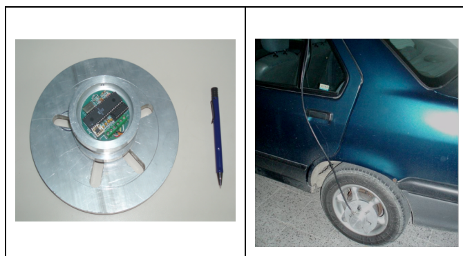
Figura 2. Quinta rueda – Instrumento desarrollado por ITESM – CIMA , Toluca –México

El dispositivo se instala en una rueda trasera del vehículo y se sujeta a los pernos de la misma, asegurándose que el cable de adquisición de datos se encuentre sin obstáculos permitiendo que la quinta rueda gire libremente. El vehículo empleado fue un Mazda Allegro Sedán de 1.3 litros de cilindrada, 4 cilindros y 16 válvulas.