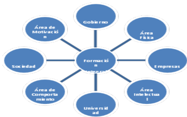
Figura 2. Engranaje Educación Empresarial Integral