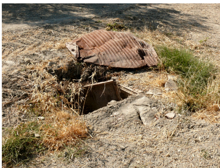
A la izquierda, galería lateral de captación de aguas de los años 20 (Autor: Antonio Pérez Ruiz). Arriba, pozo de comunicación con las galerías de canalización de los años 20 (Autor: Toni Pérez)