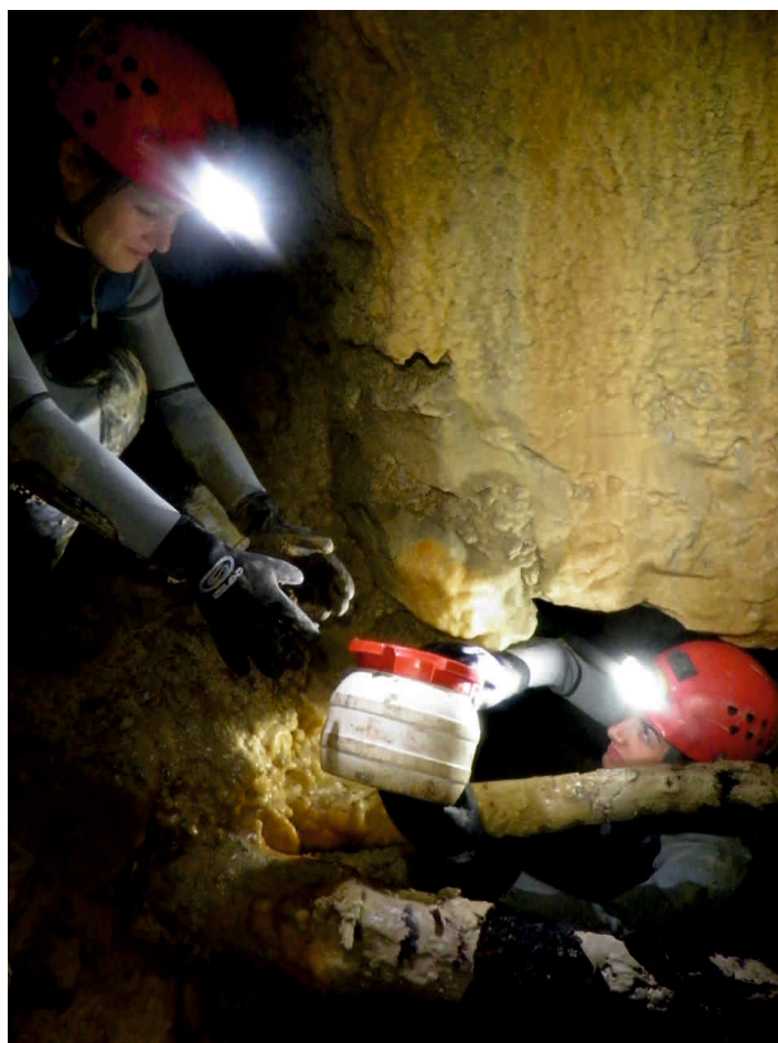
Interior de la Mina de los Frailes, galerías finales, instantes de la exploración

Este trabajo fue publicado en ARGENTARIA vol. 2, además se ha aumentado incluyendo fotografías de las abundantes lluvias de 2013 y su repercusión en la Mina de los Frailes.