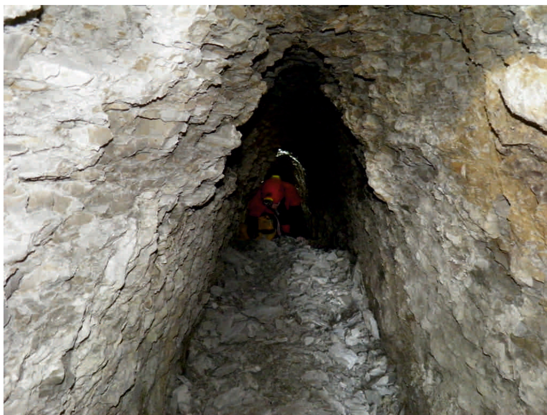
Galería inicial con material en descomposición

conseguido medir aproximadamente la dirección de esta canalización, además de conseguir de un plano de las canalizaciones de Villacarrillo, y justo la canalización iría hacia más o menos donde estaba ubicada la Fuente de la Guijarra, aproximadamente donde estaba el antiguo campo de fútbol y el actual ambulatorio.