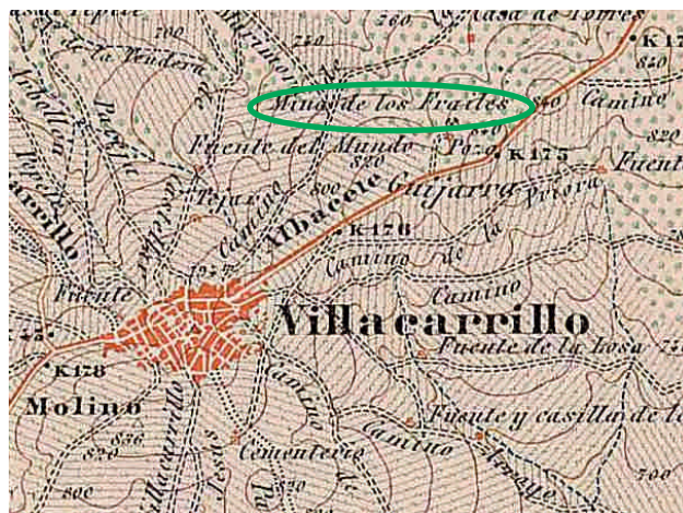
Extracto de mapa de 1899 situando la Mina de los Frailes