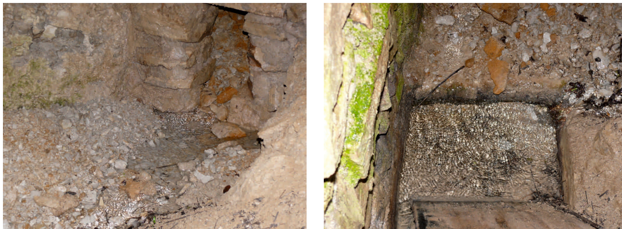
Afloramiento del agua en el interior de la Mina de los Frailes tras las abundantes lluvias de 2013

Durante las abundantes lluvias de este 2013, hemos podido constatar que el nivel piezométrico del agua en la zona ha aumentado y subido considerablemente, tanto es así que el agua brota por el interior de la Mina de los Frailes por los dos ramales anteriormente citados hasta la entrada, como así demuestran las fotografías que a continuación exponemos.