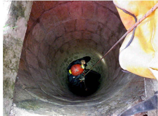
Pozo explorado el 25 de Diciembre de 2011