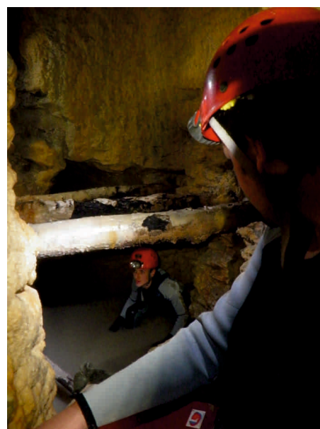
Interior de la Mina de los Frailes