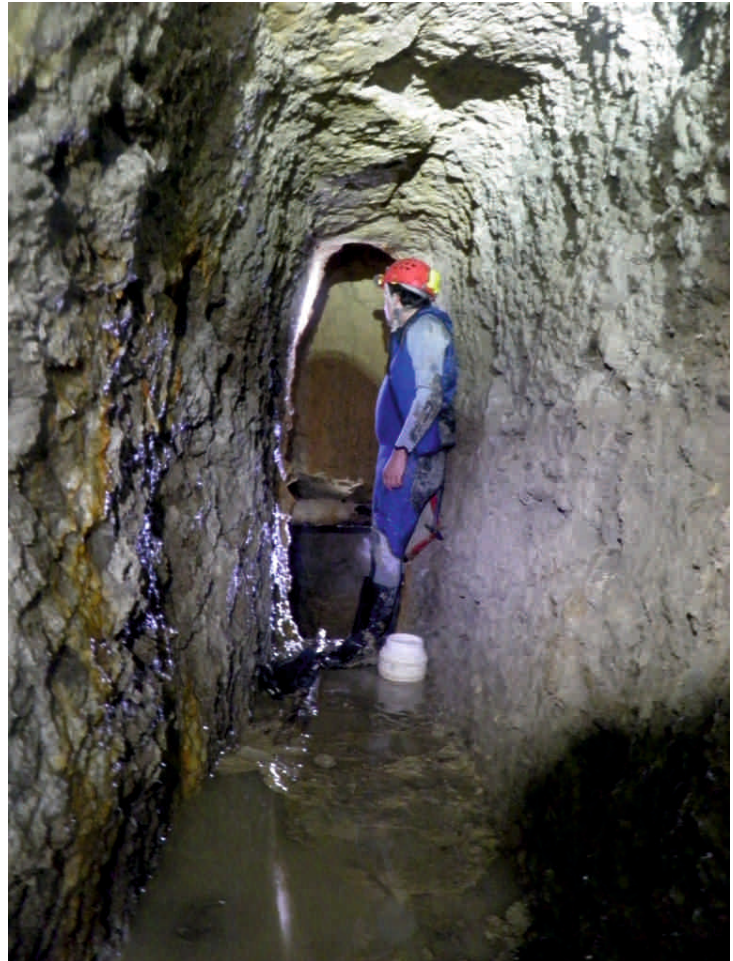
Interior de la Mina de los Frailes, galerías finales (Autor: Jesús Pérez)

Además, se ha podido constatar el hundimiento y el cegamiento de la galería lateral que iba hacia el municipio. Se han localizado parte de las paredes de la canalización, además de un pozo intermedio y algunos restos en su interior del gran lodazal que sepulta todas las paredes. Hemos