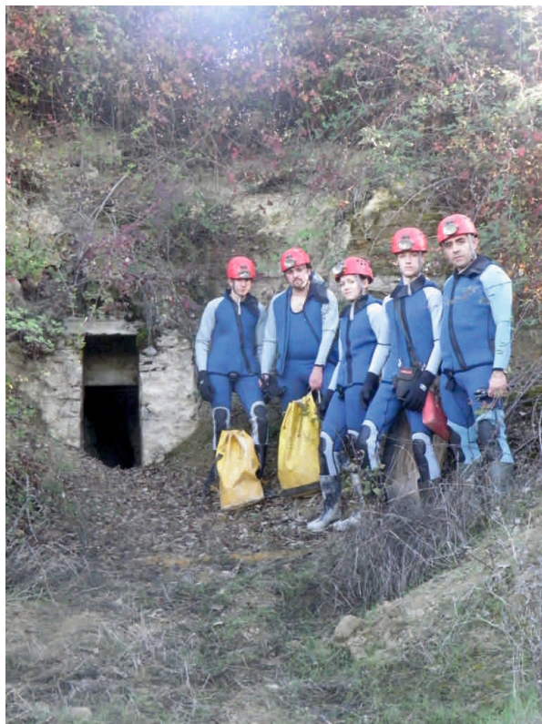
Entrada de la Mina de los Frailes