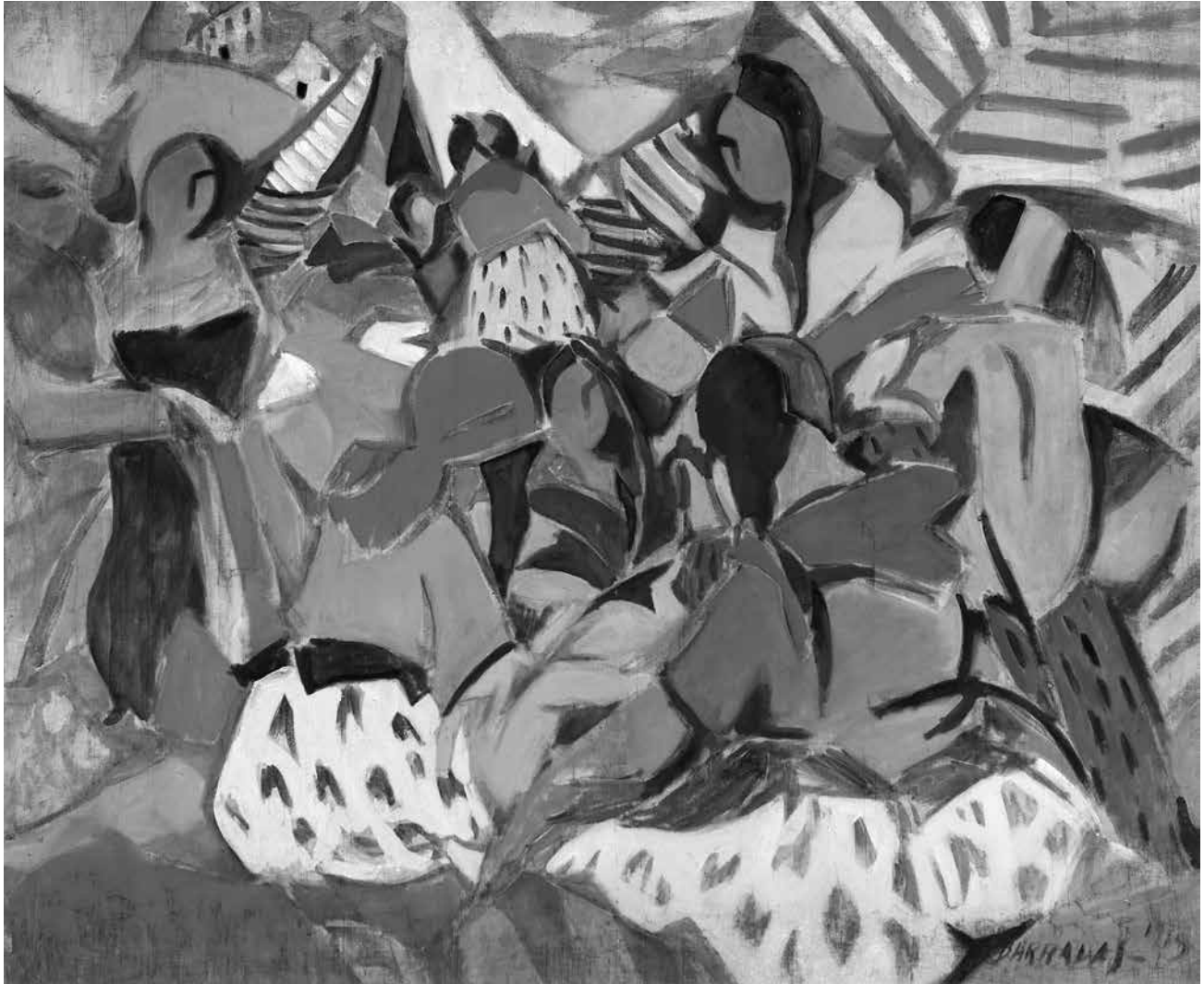
Zingaras , óleo sobre tela, 1919 | 100 x 118 cm

RAFAEL BARRADAS | NO. INVENTARIO: 1603, COLECCIÓN MUSEO NACIONAL DE ARTES VISUALES (URUGUAY)