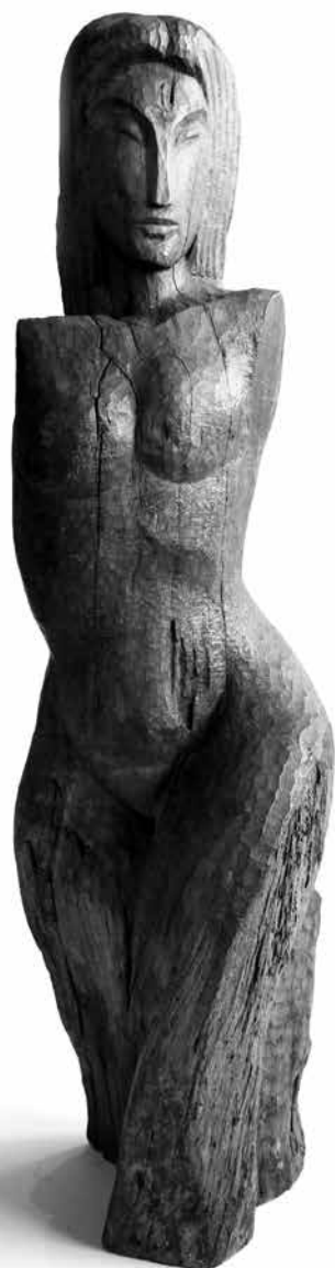
Torso femenino , talla directa en madera, 1942 | 103 x 29 x 27 cm JUAN MANUEL SÁNCHEZ BARRANTES | COLECCIÓN MUSEO DE ARTE COSTARRICENSE (COSTA RICA)

los nervios y pasiones de la gente, la sedaba a través de técnicas depresivas, perfilando aún más la depresión más dolorosa: la de la vitalidad. Todo esto abría innumerables preguntas: ¿quién era ahora el sujeto de esos derechos: el pueblo, la masa, el joven, la mujer, la multitud? Esto es, ¿quién tenía derecho al derecho? ¿Dónde ubicar el Sur y el Norte y cuáles eran sus alianzas y relaciones de dominación? ¿Dónde quedaba la anhelada nación e instituciones como la educación en ese nuevo mapa? Es decir, ¿cuál era la nueva geografía y relieve de lo que cómodamente llamamos sociedades ? ¿Cómo se compañía lo social? ¿Cómo el consumo de bienes e