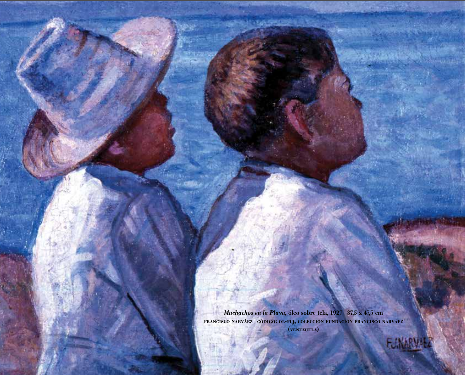
Muchachos en la Playa , óleo sobre tela, 1927 | 37,5 x 47,5 cm FRANCISCO NARVÁEZ | CÓDIGO: 01-113, COLECCIÓN FUNDACIÓN FRANCISCO NARVÁEZ (VENEZUELA)