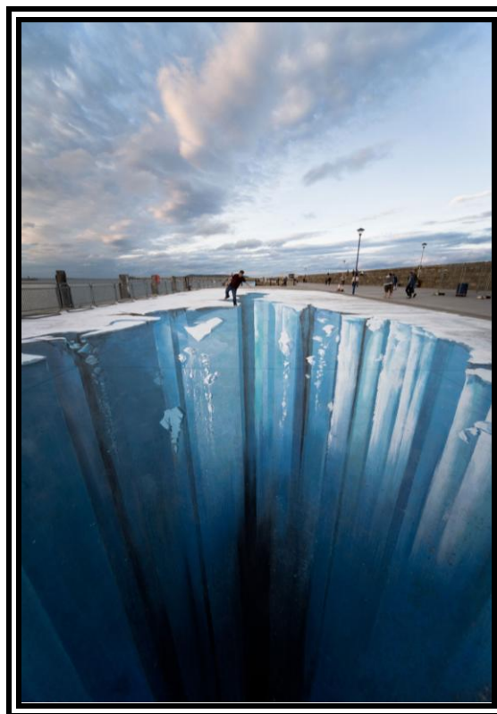
Ilustración 1. Cita Visual Literal. Mueller, Edgar. The Crevasse . Pintura – Instalación. 2008. Procedente de: Festival of World Culture , Dun Laoghaire, Irlanda ( http://www.metanamorph.com ).

Aliance for Art Education (WAAE), National Art Education Association (NAEA) o la Red Iberoamerica de Educación Artística (RIAEA)... A su vez se han realizado diversos informes nacionales e internacionales sobre la importancia de la Educación Artística y la creatividad (algunos de los cuales se citán aquí). Estos avances en el campo teórico de la Educación Artística son absolutamente necesarios si buscamos un mínimo de coherencia en nuestros sistemas educativos. Nos preguntamos sobre la importancia que se le da hoy en día a las asignaturas artísticas (artes plásticas, teatro, música, danza,...). Vemos que existen buenos libros de texto, ambiciosos planes de estudio sobre estas materias y pensamientos lúcidos, pero ¿cómo es la práctica en realidad? Según expresa claramente Anne Bamford en su investigación supranacional encargada por la UNESCO para determinar el estado de la Educación Artística a nivel internacional: “hay un abismo entre lo que se dice y lo que se hace” 6 .