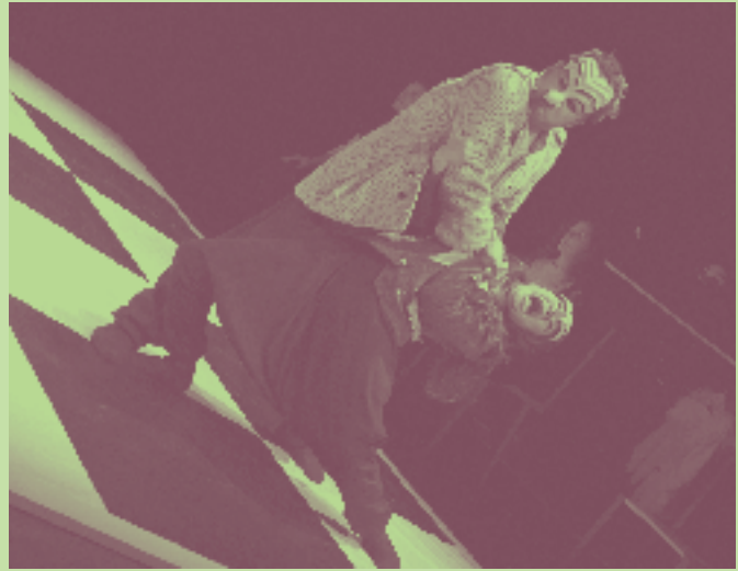
▲ De ricos y avaros: subversivos postmodernos. Fotografía, Nelson Campos. Año, 2013.