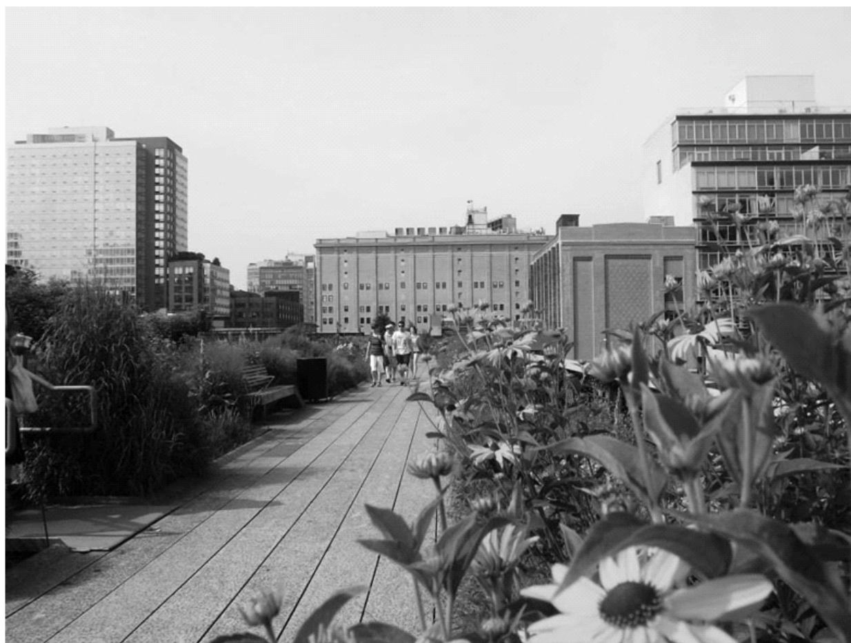
Fig. 3- El Highline Park, paradigma del landscape urbanism. New York.

Otro enfoque corresponde al ya enunciado en párrafos anteriores Landscape Urbanism . Este último es sobre el cual encuentro mayores aportaciones hacia los puntos en que se enfoca este texto. Puesto que, tal y como James Corner (2005) afirma en Terra Fluxus - texto que inaugura, celebra y ubica el momento y lugar en el que está el Landscape Urbanism -, uno de los aportes torales de este campo es la incorporación del imaginario colectivo; dado que informa y estimula las experiencias del mundo material y por ello debe continuar como el motor principal de cualquier tentativa creativa. Según Corner, las fallas de la planeación urbana del siglo XX se deben al empobrecimiento de la imaginación con respecto a la racionalización optimizada del capital y, con ello, su poco aprecio hacia el perdido tema del imaginario.