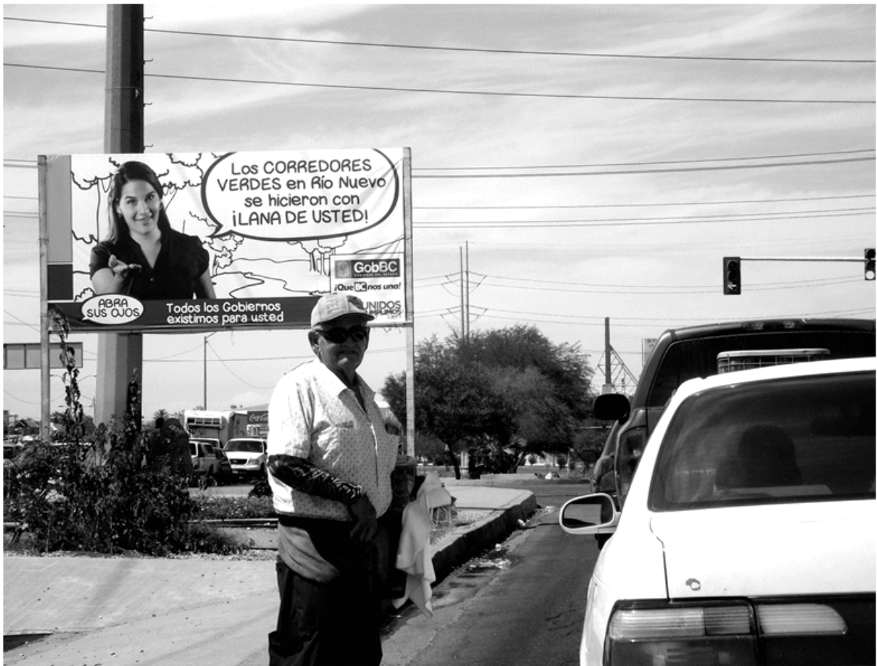
Fig. 1- Intersección vial en la zona del río Nuevo. Mexicali, México.