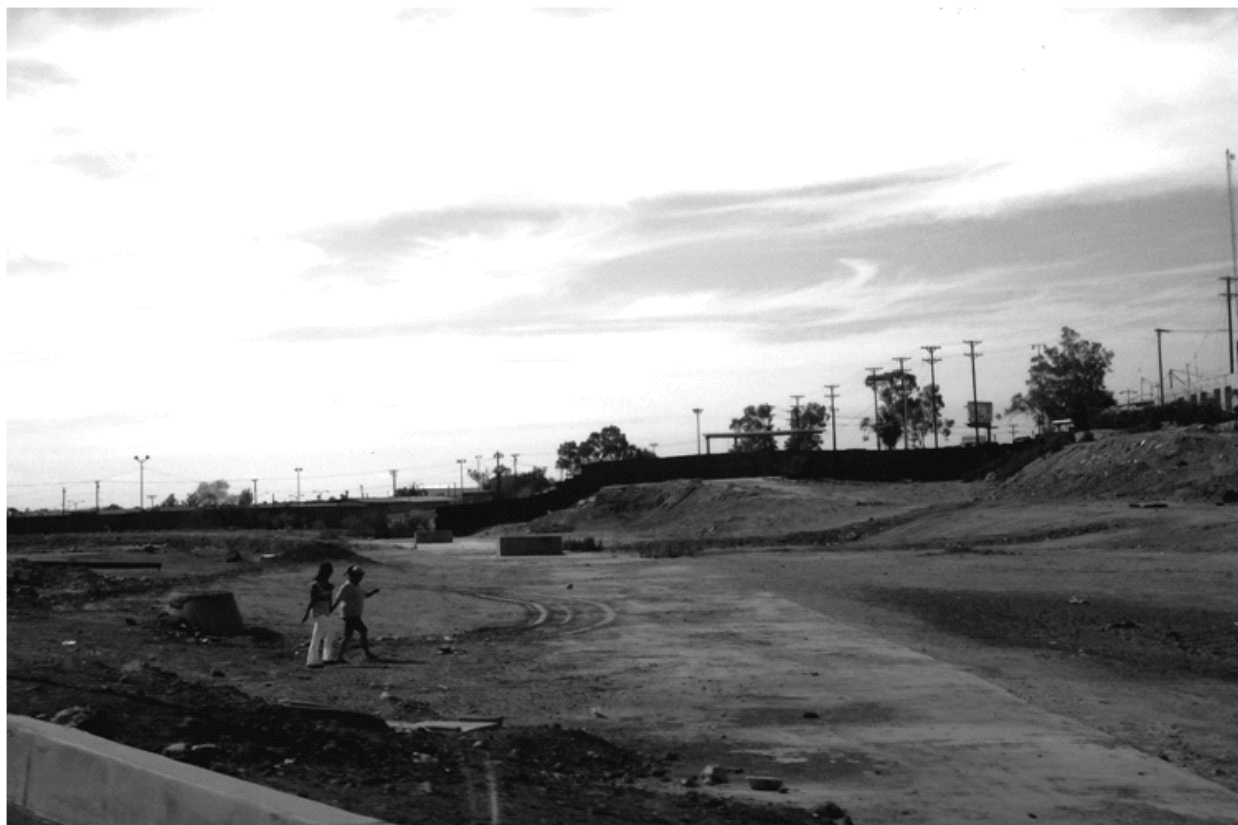
Fig. 4- Baldío en la zona del río Nuevo, al fondo el muro-frontera de Estados Unidos de América.