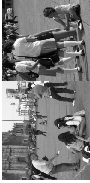
Espacio de Microambulante