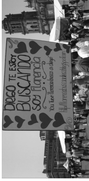
Escenario Red de Comunicación