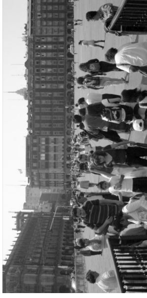
Espacio de Circulación Permanente