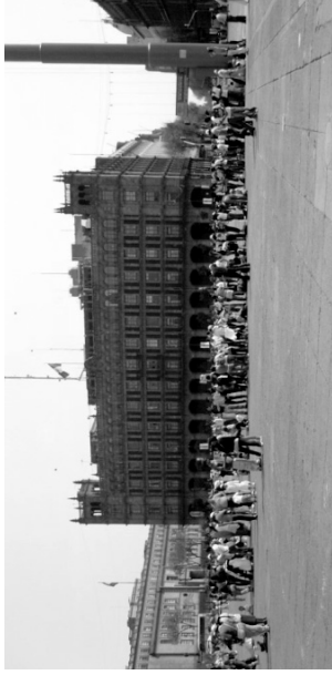
El Reloj Solar-La Sombra Social