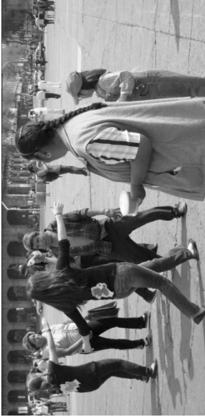
Escenario de lo Inesperado