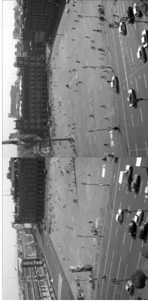
Plancha Vista Panorámica