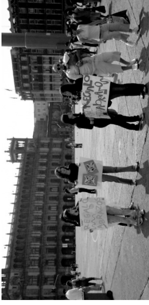
Escenario de lo Inesperado