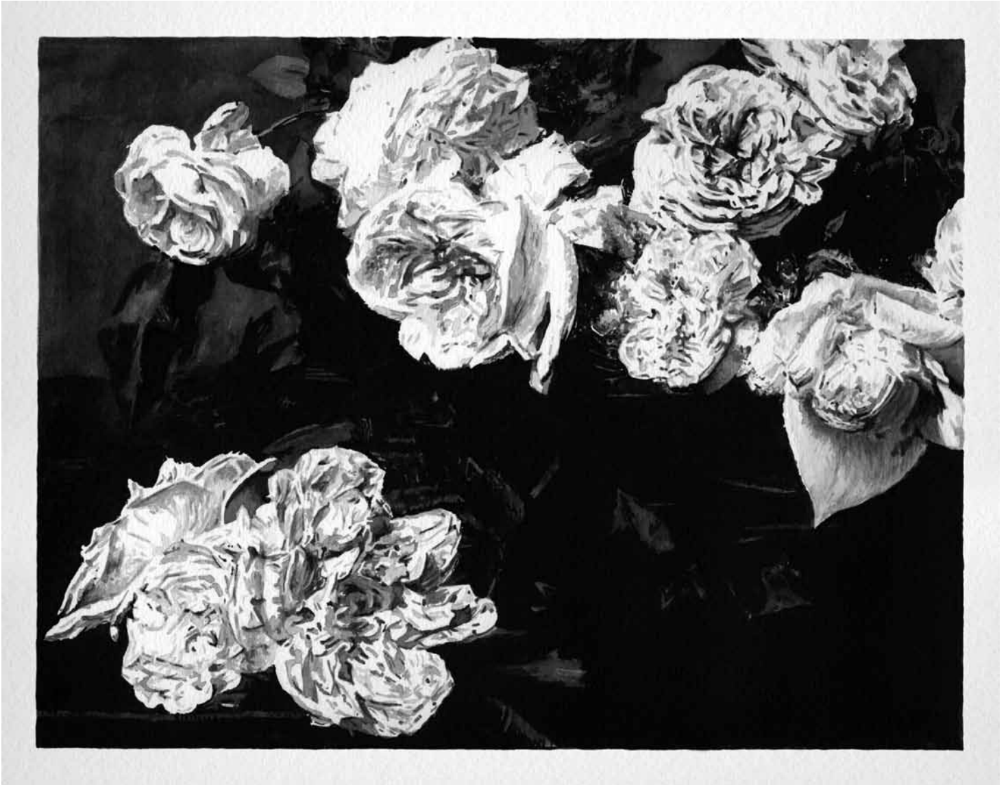
Power corruption & Lies • Peter Saville, Henri Fatin-Latour (Watercolor on paper, 2013)