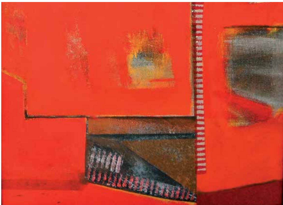
Comunidade em vermelho 2 (fragmento) , de la serie Cidade encoberta . Técnica mixta, 80 x 80 cm, 2013