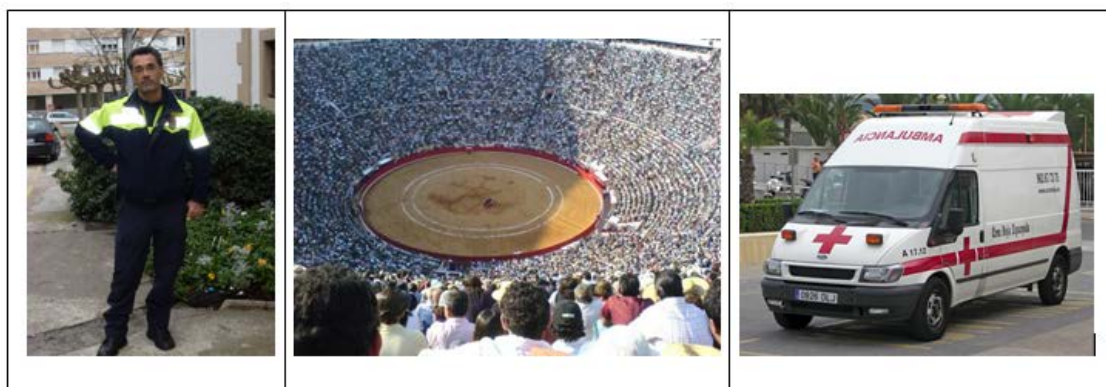
Figura 1. Imágenes de identificación

Se han grabado en total 12 encuestas lingüísticas. La edad de los informantes oscila entre los 5 y los 85 años y los hemos clasificado en seis generaciones: 1 (1920-1935); 2 (1936-1950); 3 (1951-1965); 4 (1966-1980); 5 (1981-1995), y 6 (1996-2008). Hay que destacar la dificultad que tuvimos para localizar informantes de edad temprana que fuesen seseantes. Así, se realizaron quince entrevistas previas entre niños de 4 y 5 años, de los que tan sólo se registraron dos casos positivos de seseo, dándose además la circunstancia en uno de ellos (IF-1) de que era nieto de otro de los informantes (JAA-9).