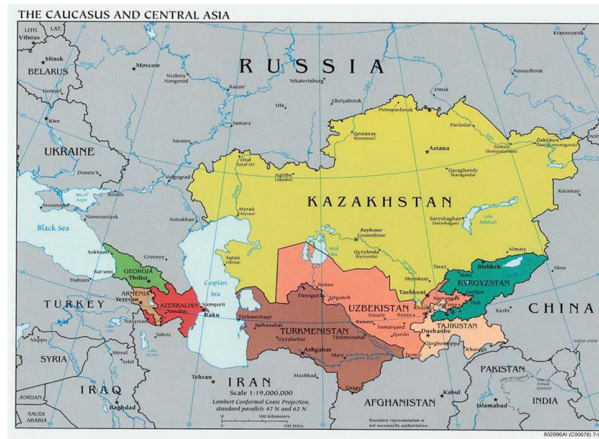
MAPA GEOGRÁFICO DE ASIA CENTRAL