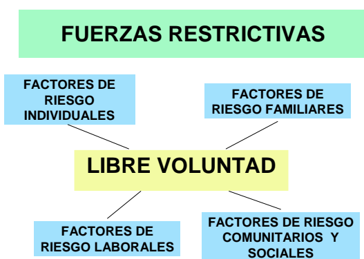
Gráfico N° 2: “Las Fuerzas Restrictivas del Individuo”

Autor: NSCIC, Programa de Cultura de la Legalidad para Colombia.