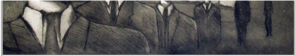
En la línea recta, aguafuerte, aguainta, lavis y raspador, 2005