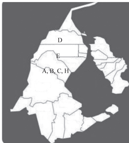
Figura 1. Mapa del Estado Zulia con la ubicación de las plantas sacrificadoras (A,B,C,D y E) utilizadas en el estudio.

Venezuela, unas 16.000 toneladas, en mataderos concentrados en los municipios de Maracaibo, San Francisco y Mara (Fig. 1).