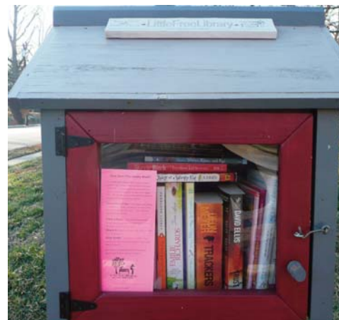
Pequeña biblioteca gratuita.