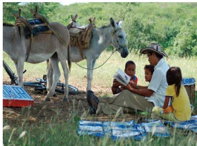
Biblioburro. En plena lectura bajo la sombra