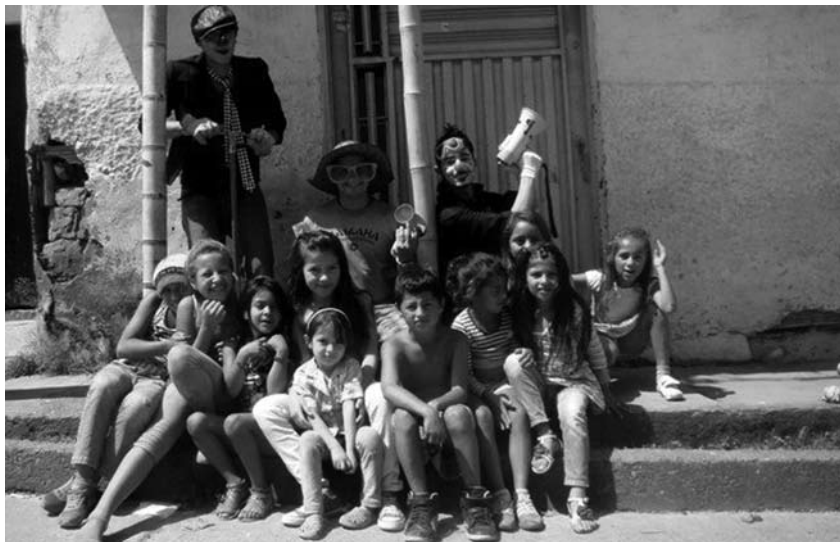
Abajo Izquierda. Cartografía ambulante con el grupo de perifoneo.