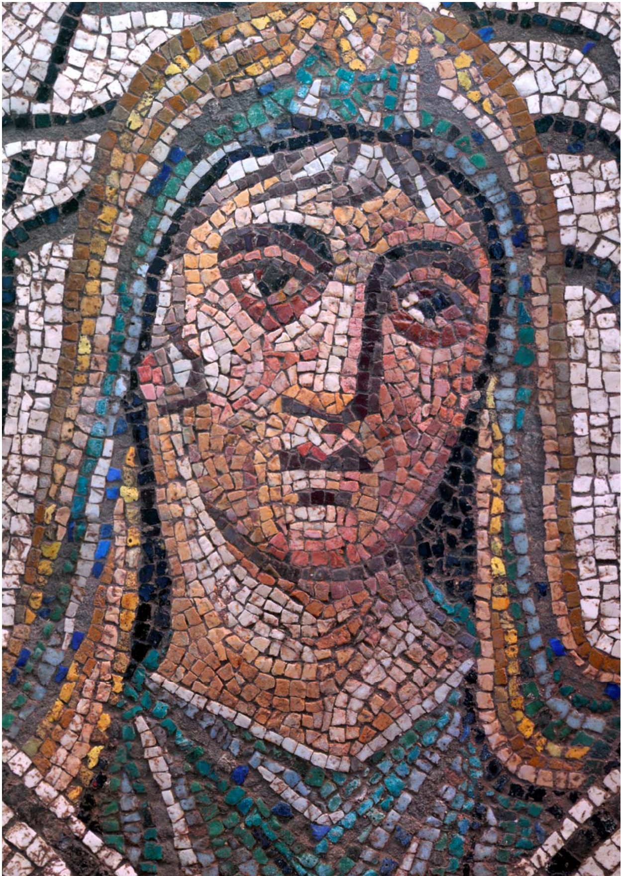
Lám. 3: Alegoría del Invierno