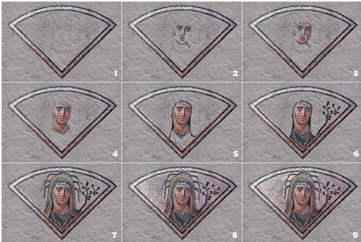
Lám. 4: Paleta de color (arriba) y Lám. 5: Estratos en la ejecución del pavimento y diagrama estratigráfico (abajo)

Mediante esta investigación se pretende realizar una primera propuesta de aproximación a la arqueología del trabajo, a la metodología y a los artesanos que componían el equipo que elaboró esta singular obra. El análisis del mosaico completo de la sala, así como de los diferentes mosaicos documentados en el mismo edificio, sumando una multitud de detalles constructivos, nos permitirá profundizar en el día a día del proceso de trabajo que culminó en esta realización única■