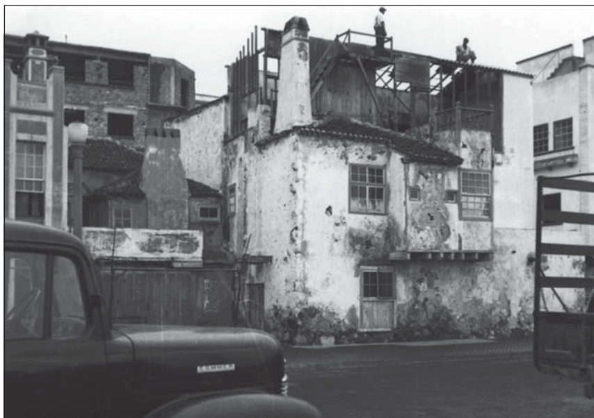
Desmontaje de la cabaña del gabinete de Manuel Cabrera. Finales de la década de 1950