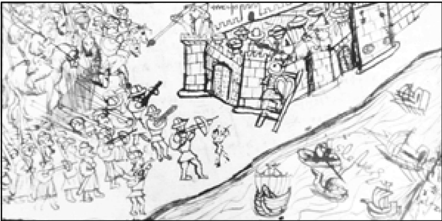
Ilustración 3.- Idealización del cerco a Tarifa en 1294, según el extremeño Pedro Barrantes Maldonado, historiador de la Casa de Niebla en el siglo XVI. Real Academia de la Historia.

De momento sólo indicar que los historiadores norteafricanos contemporáneos al conflicto –Ibn Jaldún e Ibn Abi Zar– son los primeros en hablar de esta cooperación entre Granada y Castilla, corroborada posteriormente por Ibn al-Jatib, 39 así como por las fuentes genovesas 40 y por la documentación del reino de Aragón. 41 Conjugando la información que aportan fuentes y documentos, llegamos a la conclusión de que hubo un pacto entre el rey de Granada –como vasallo– y el rey de Castilla –como señor– para colaborar contra los benimerines, tanto por tierra como por mar, y repartirse luego las ganancias obtenidas; como el botín a repartir eran las villas de Algeciras y Tarifa, cabe la posibilidad de que al reino castellano se adjudicara en el reparto la mayor de las dos villas por cargar con el esfuerzo principal de la campaña, mientras que Granada se quedaba con Tarifa. Tal vez no fuese ésta la situación óptima para ninguno de los aliados, pero dadas las circuns-