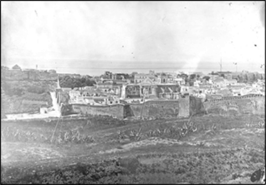
Ilustración 7.- Vista de Tarifa desde uno de los padrastrros de la zona oriental.

Tarifa 114 la pone el autor en relación directa con la vuelta al rey de Castilla de la embajada que éste envió al rey francés, 115 Felipe IV, en la primavera de 1291 para dar explicaciones de los términos del acuerdo que había contraído con Jaime II de Aragón en el otoño del año anterior.