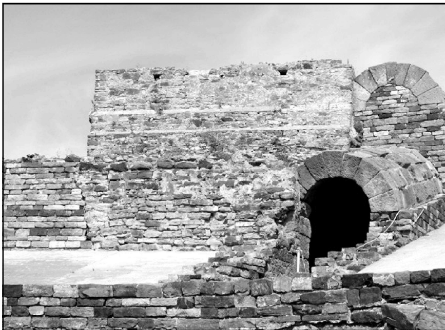
Ilustración 8.- Arranque de la torre medieval sobre el lado occidental de la cávea del teatro de Baelo.

Así las cosas, es posible que la dirección de las operaciones na-