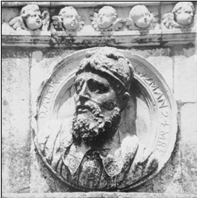
Ilustración 11.- Medallón que representa a Alonso Pérez de Guzmán el Bueno en la fachada del Convento de San Marcos en León.