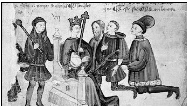
Ilustración 1.- Queda patente que esta viñeta del Libro de los Castigos está cargada de simbolismo didáctico y religioso.

Pero no es éste el único documento donde Sancho IV se muestre ufano por la incorporación de Tarifa a la corona de Castilla, así como su interés por mantenerla dentro de los dominios castellanos a pesar de las muchas dificultades que ello le acarreó. Una muestra de lo anterior puede ser la carta escrita a los obispos de su reino, 3 aunque la que hasta nosotros ha llegado vaya dirigida concretamente al obispo, al deán y al cabildo de la Iglesia de Badajoz; en la misma hace alusión don Sancho a los muchos sacrificios realizados para la conquista de Tarifa, al tiempo que insiste en la importancia estratégica que tenía la plaza para los musulmanes de África cuando dice que «[...] aquel era el meior paso que ellos avian, et mas seguro para pasar a la nuestra tierra et para tonar a la suya