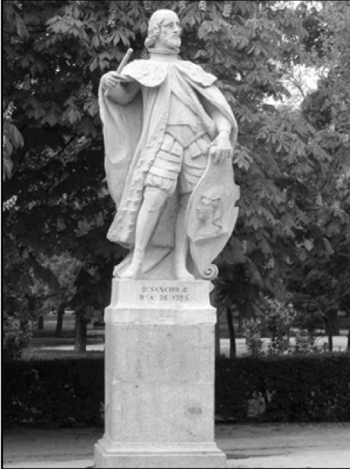
Ilustración 4.- Estatua de Sancho IV el Bravo, esculpida en piedra blanca por Francisco de Vògue entre 1750 y 1753. Parque del Buen Retiro de Madrid.

Como de estos embajadores de Tremecén no hablaremos hasta más tarde, digamos ahora que las relaciones entre Castilla y Aragón habían mejorado ostensiblemente con la llegada de Jaime II al tro-