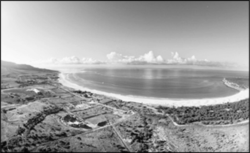
Ilustración 9.- Vista reciente de la ensenada de Bolonia. Bajo la línea de nubes, en el horizonte, se aprecian las relativamente cercanas costas de África.

en esta carta que la totalidad de la flota aragonesa continuaría en el Estrecho a disposición de Sancho IV, y aunque no se precisa por cuánto tiempo más, cabe suponer que fue hasta la llegada del invierno. 158