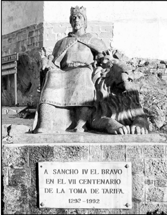
Ilustración 5.- Escultura sedente de Sancho IV el Bravo, colocada junto a la entrada del castillo de Tarifa. Obra de Manuel Reiné Jiménez.

de Luna y Fernán Pérez Maimón, en los días finales de agosto de 1294 cuando se acababa de levantar el primer cerco de los benimerines a la Tarifa cristiana. 84 En estas fechas, los dos consejeros propusieron al rey de Castilla un nuevo proyecto para apoderarse de Algeciras en la primavera del año siguiente y, dado el paralelismo circunstancial existente entre 1292 y 1294, suponemos que el plan de operaciones de este último año tal vez no fuese muy diferente al que se pudo elaborar con la misma finalidad a principios del año 1292, plan pensado para actuar sobre Algeciras aunque finalmente dio como resultado la conquista de Tarifa. Este documento de 1294 del que vamos a hablar resulta muy interesante por la cantidad de detalles que proporciona, así que a falta de datos más directos sobre la campaña de 1292, lo tomaremos como referencia para esta última.