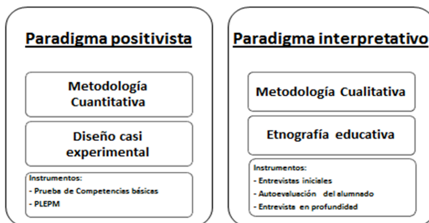
Figura 3: Metodología de la investigación. Elaboración propia