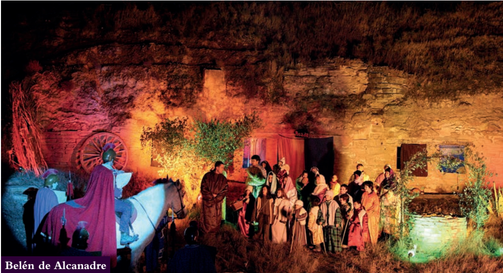
Belén de Alcanadre