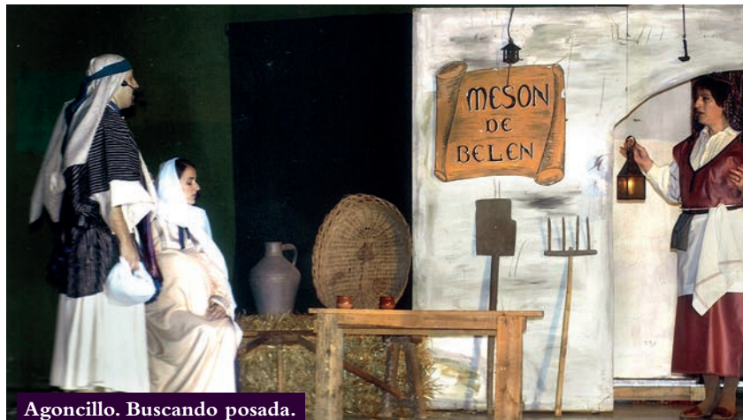
Agoncillo. Buscando posada.

Hay que destacar que de alguna u otra manera también hay varias representaciones de Belenes Vivientes en el resto de La Rioja. En la década de los noventa, en Logroño se hacía una repre- sentación en el parque de la Cometa. Grañón celebra previo a las navidades un mercado na- videño inspirado en un belén. El Colegio de la Piedad de Nájera, monta un grandioso belén humano en el patio del centro el último día de clase antes de Navidad. Sin afán de ofender, pues quizás se haga alguno más, a grandes ras- gos, se podría afirmar que cada Navidad, en La Rioja se arma buen belén.