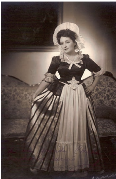
Como Susana, en Las Bodas de Fígaro , de Mozart.

nombrados, como Ernesto Halfter, Eduardo Toldrá o Jesús Guridi, así como el tan omnipresente Joaquín Turina entre otros. Dentro y fuera de España será la sublime intérprete de Falla en sus Siete Canciones Populares , La Vida Breve o El Retablo de Maese Pedro .