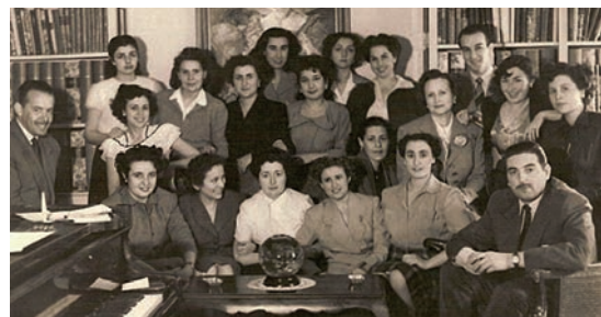
Con sus alumnos en su estudio de Martínez Campos 17, en Madrid, mayo 1950.