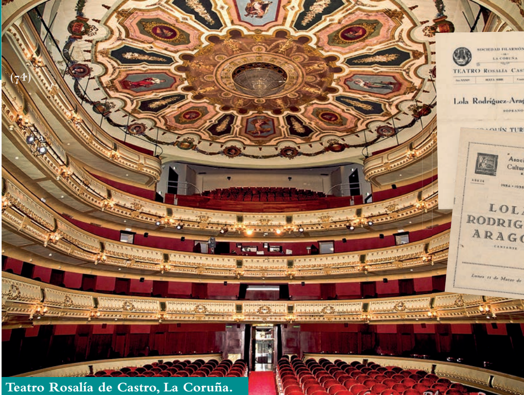
Teatro Rosalía de Castro, La Coruña.