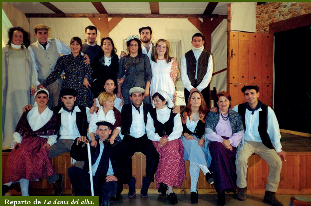
Reparto de La dama del alba .

libre a divertirse y pasar ratos agradables ensayando sus personajes para más tarde transmitirlo a su gente. En estos momentos, el único grupo de teatro que queda en el municipio, compuesto por aficionados, es el grupo Tejao de Cera, que se formó como tal en el año 1998, pero ya existía desde años atrás, cuando un grupo de chavales se reunía para ensayar y representar distintas obras, sobre todo de humor. Actualmente, es una asociación de carácter benéfico que colabora con diferentes organizaciones de nuestra región.