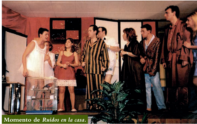
Momento de Ruidos en la casa .

“Por favor, por favor. ¡Que queremos ir!” Esto es lo que se oye en muchos a niños de Albelda cuando va a comenzar la función teatral del grupo Tejao de Cera. Con esta frase comienza el prólogo de Ana María Matute al estudio sobre la historia del teatro en La Rioja El camino de la legua. Titiriteros y comediantes por los pueblos de La Rioja . El teatro en nuestros pueblos tuvo gran difusión desde finales del siglo XIX con un claro objetivo: la evasión del día a día, entretener a la gente para que olvidara las penurias de su existencia, que en la sociedad rural riojana de principios de siglo eran abundantes.