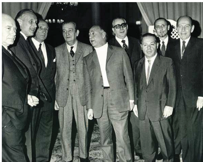
Ionesco con Buero Vallejo y López Rubio

E.I.- ... Pero también he sufrido y hoy sufro sin más consuelo en mi doloroso viaje nocturno que unas manzanas samaritanas que me cambian de costado.