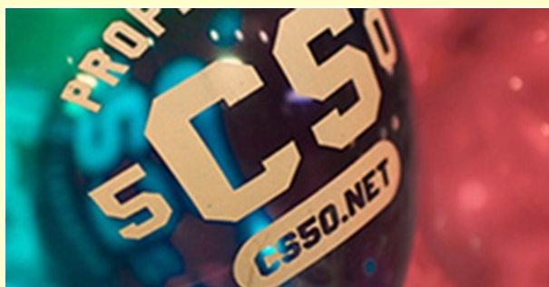
Figura 5. Acceso al curso

CS50x: Introduction to Computer Science EDX