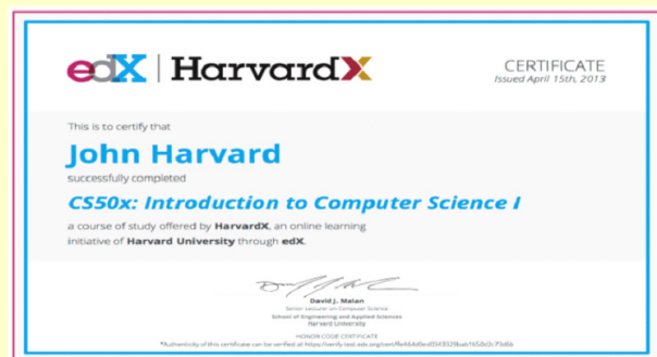
Figura 4. Ejemplo de título expedido por Harvard desde la plataforma EDX para el curso Introduction to Computer Science. Para ver las estadísticas del curso y los resultados a través de su profesor visita https://blog.cs50.net/