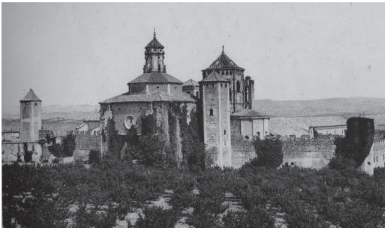
Postal del monestir de Poblet, 191?