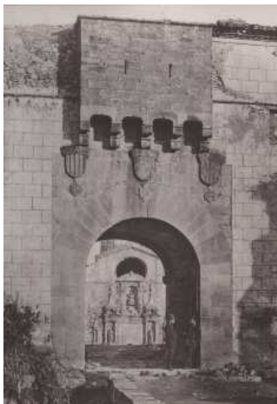
Imatges del monestir de Poblet extretes de l' Àlbum pintoresch monumental de Catalunya. Poblet . Associació Catalanista d' Excursions Científiques, Impremta de Riera (Barcelona), 1878.

va progressant en el coneixement dels fets. N'és un bon exemple la troballa d'una missiva d'un dels frares, Bernat Nogués, on narra l'episodi succeït al cenobi cistercenc l'any 1650, quan fra Pere Llobera protagonitzà una rocambolesca fugida a trets d'arcabús.