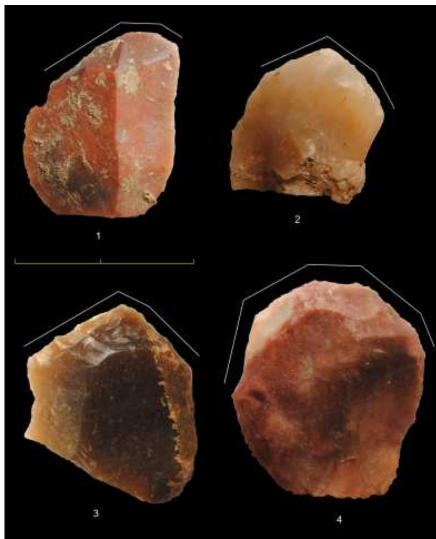
Figura 3. Gratadors retocats després de l'exposició al foc.

Pel que fa als útils simples, els gratadors són el grup tipològic més nombrós (37,4%), seguits dels elements de dors (19,4%), dels denticulats (12,5%) i de les ascles retocades (12,4%). La resta d'útils (abruptes, burins, perforadors, rascadores i truncadures) mostren freqüències més baixes. Hi ha peces cremades a tots els grups tipològics (Taula 2). Si considerem només els artefactes retocats després de l'exposició al foc, alguns grups tipològics tenen percentatges similars als que assoleixen al conjunt de les peces retocades, però altres mostren diferències significatives. Els elements de dors són el segon grup més important en el conjunt de la indústria, però només representen un 3% de les peces retocades després de l'alteració tèrmica. Les ascles retocades mostren la tendència contrària, ja que el seu percentatge entre les peces retocades després de haver estat cremades és sensiblement superior (24,7%) al que tenen en tot el conjunt.