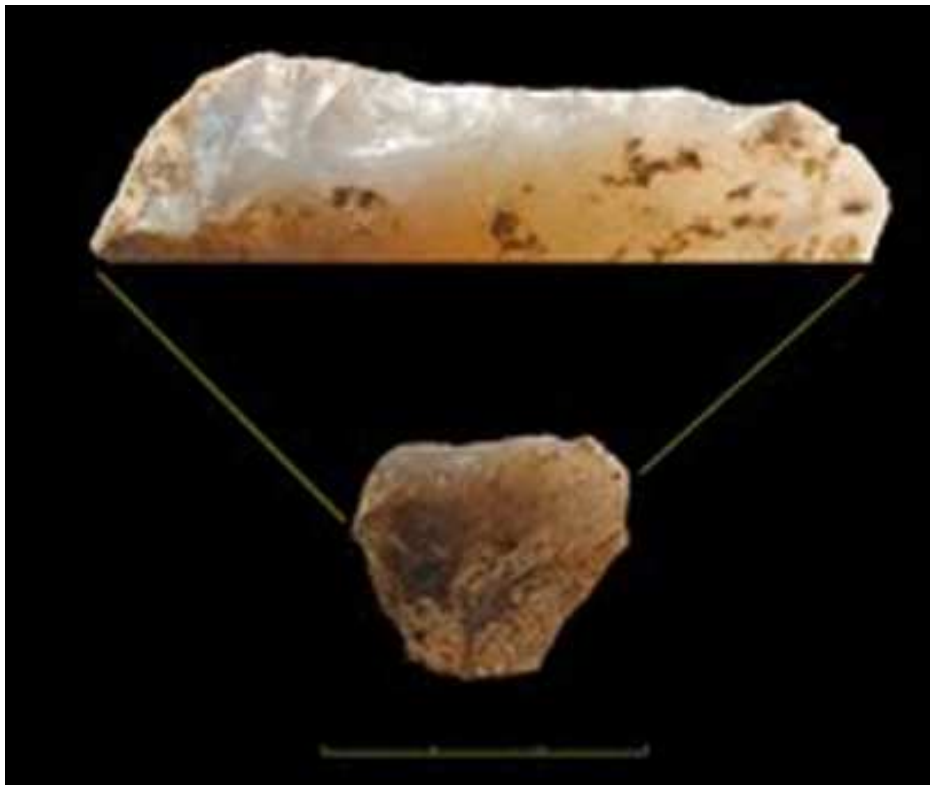
Figura 1. Gratador retocat després de l'exposició al foc. Ampliació de la vora retocada en la qual es pot apreciar el llustre greixós característic dels retocs posteriors a l'alteració tèrmica.

Els artefactes retocats han estat analitzats i classificats d'acord amb la Tipologia Analítica i Estructural de G. Laplace (1972), encara que només la seva adscripció segons els principals grups tipològics ha estat emprada en aquest treball. Tanmateix, hem inclòs un grup tipològic que no apareix a la Tipologia de Laplace, el de les ascles retocades. Aquest grup inclou els artefactes que han estat retocats, però no mostren les morfologies estandarditzades que caracteritzen la resta dels grups tipològics. Hem prestat una atenció especial a la distinció entre els útils simples – és a dir, els artefactes que presenten només un tipus d'útil – i els útils múltiples, que mostren diferents tipus configurats sobre un mateix suport. Cal dir que hem considerat un dels tipus de gratadors definits per Laplace – el gratador amb retoc lateral – com un útil múltiple, ja que presenta dos costats retocats amb característiques diferents.