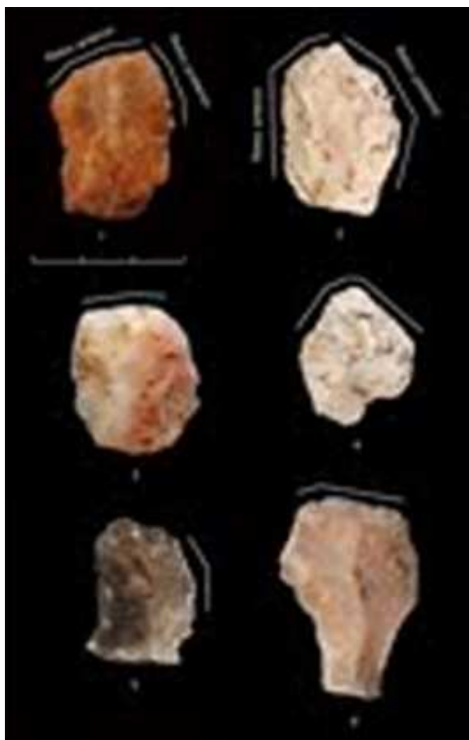
Figura 2. Útils retocats després de l'exposició al foc. Les línies blanques indiquen la localització dels retocs. 1, 5. Ascles retocades. 2. Gratador amb retoc lateral. 3, 4, 6. Gratadors. 1 i 2 foren retocats tant abans com després de l'alteració tèrmica.