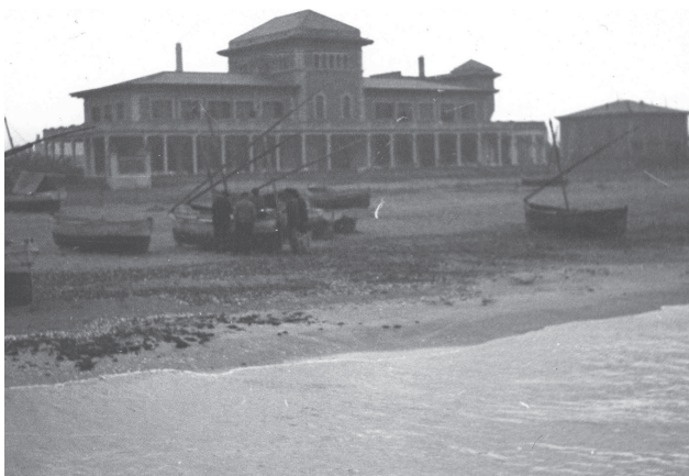
Vista de las huertas en el cauce del río Turia y, debajo, la playa de la Malvarrosa, en Valencia.