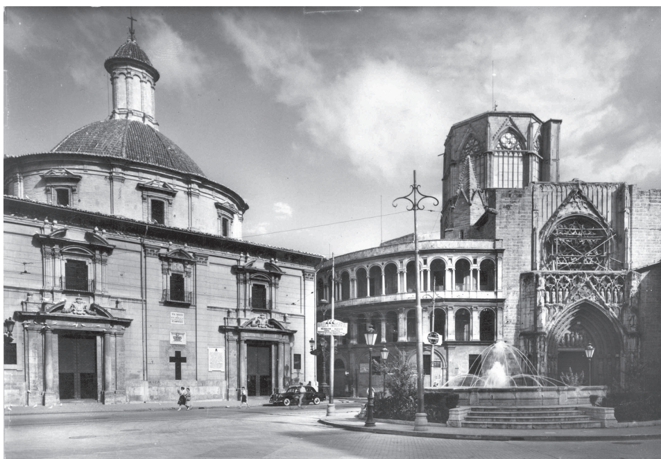
Dos vistas de Valencia: la calle de la Paz, donde se encontraba el Hotel Balear, que sirvió de alojamiento a Escrivá de Balaguer y Fernández Vallespín en 1936, y, la Plaza de la Virgen de los Desamparados.