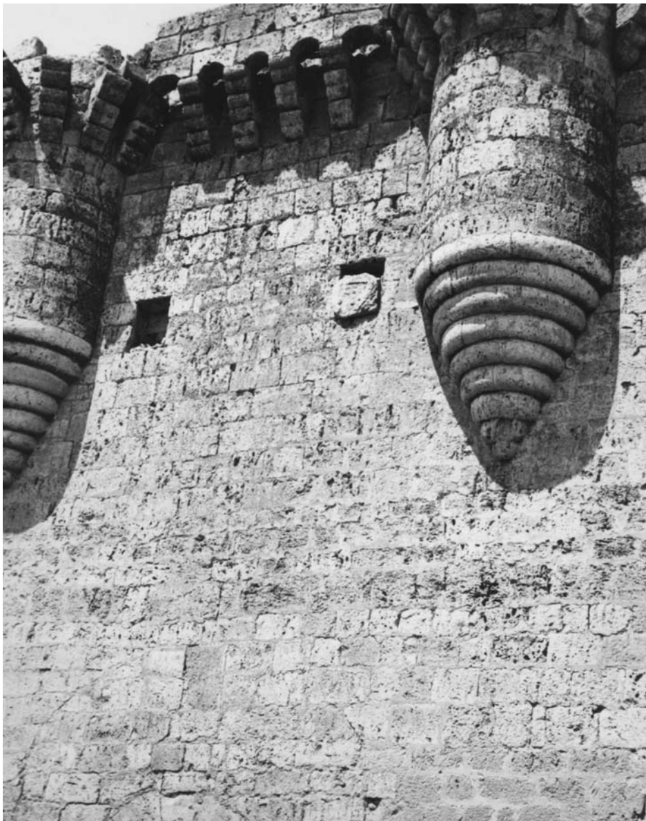
Fuentes de Valdepero (Campos): entrada primitiva. Entre las garitas, había dos escudos. Queda colgado justamente el maltratado ejemplar, que manifiesta ser del apellido Sarmiento. Aunque existe también en un cubo el escudo del Diego Pérez de Sarmiento, Adelantado Mayor de Galicia, fallecido en 1466, tengo dudas sobre su fiabilidad para confirmar la fecha o el autor de la construcción.