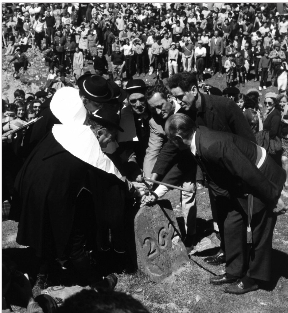
Tributo de las tres vacas de Roncal y Baretous, declarado BIC del patrimonio cultural inmaterial de Navarra (2011).

No sería justo, sin embargo, en estos momentos de trabajo incipiente y profunda crisis económica, valorar las medidas de salvaguarda, difusión y transmisión del PCI implementadas por la Administración foral. Sí lo es, en cambio, analizar cómo ha calado en ella la sensibilización y la superación de visiones patrimoniales caducas. Creemos que, tras más de diez años de trayectoria, el patrimonio cultural inmaterial ya no despierta ni recelos ideológicos ni falsos dilemas en torno a la cohesión social; que se ha captado la importancia de esta dimensión renovadora del patrimonio (tan importante en Navarra); y que tendrá reflejo creciente en los planes estratégicos futuros. Seamos optimistas.