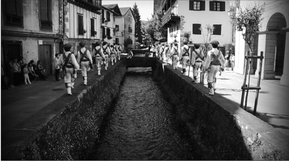
San Fermín de Lesaka. Ezpatadantzariak (danzantes).

Si partimos de un ejemplo concreto desde el que proseguir nuestras reflexiones, iremos comprendiendo mejor la trascendencia del cambio. A partir del 6 de julio, Lesaka, pueblo del Pirineo navarro, celebra las fiestas de San Fermín en las que, además de otras muchas manifestaciones culturales y festivas, están presentes la música y las danzas tradicionales. El 7 de julio, el día grande, con misa y procesión, es el único día del año en el que bailan los ezpatadantzaris , los danzantes lesakarras. Entre otras danzas, bailan el Zubigainekoa (encima del puente), un baile que es símbolo de la paz que se firmó en el siglo XV entre los barrios de Lesaka. Permítaseme centrarme en esta danza 21 . Los dantzaris bailan en los pretils y el puente sobre el río Onín, afluente del Bidasoa, poniendo a prueba su equilibrio, como se aprecia en la fotografía. En este ritual bailado, un capitán dirige a la comitiva formada por un número par de jóvenes en dos filas, unidos entre sí y al capitán por makilas (bastones). Su atuendo es blanco con escapularios y cintas de colores, alpargatas y cascabeles en las pantorrillas. Por último, como final de la danza, se ondea la bandera de la villa sobre el puente.