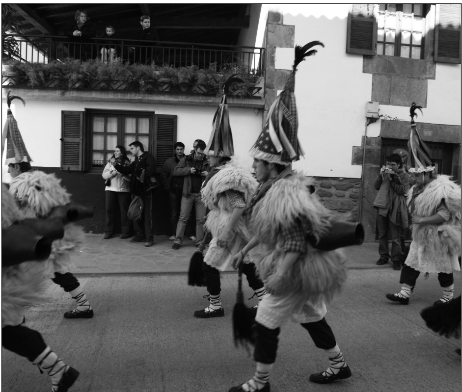
Ioaldunak! Carnaval de Ituren, Aurtitz y Zubieta. Primera declaración BIC del patrimonio cultural inmaterial en Navarra (2008).