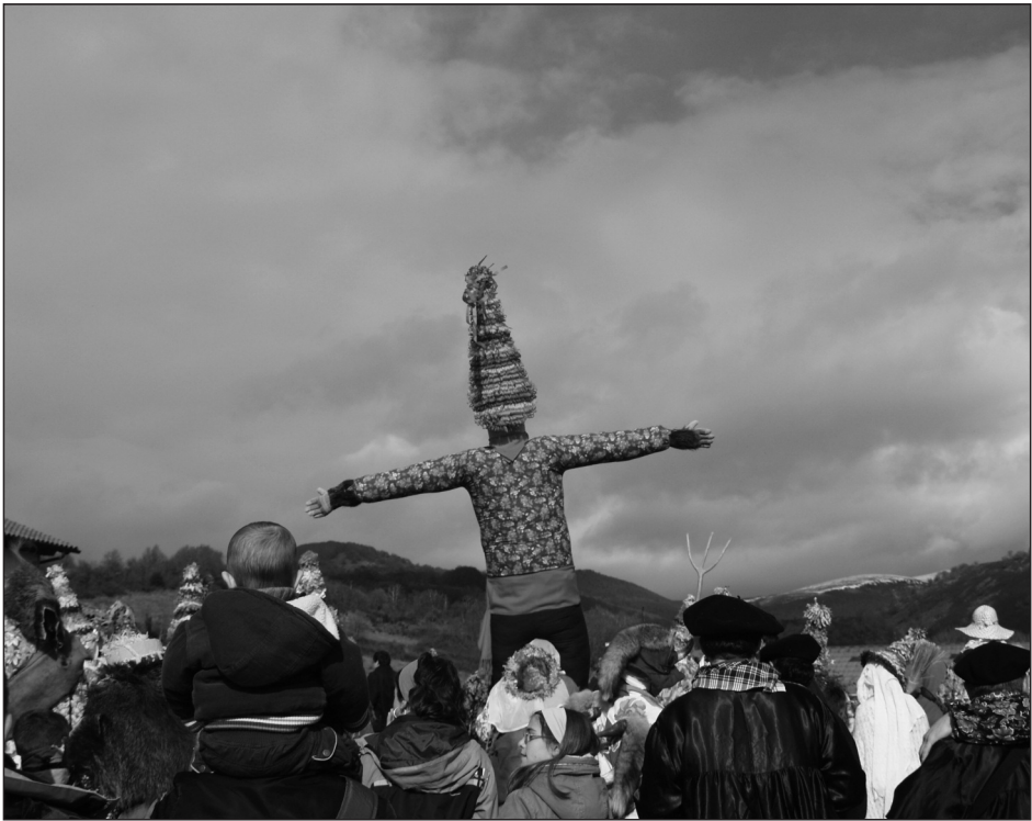
Carnaval de Lantz. Primera declaración BIC del patrimonio cultural inmaterial en Navarra (2008).