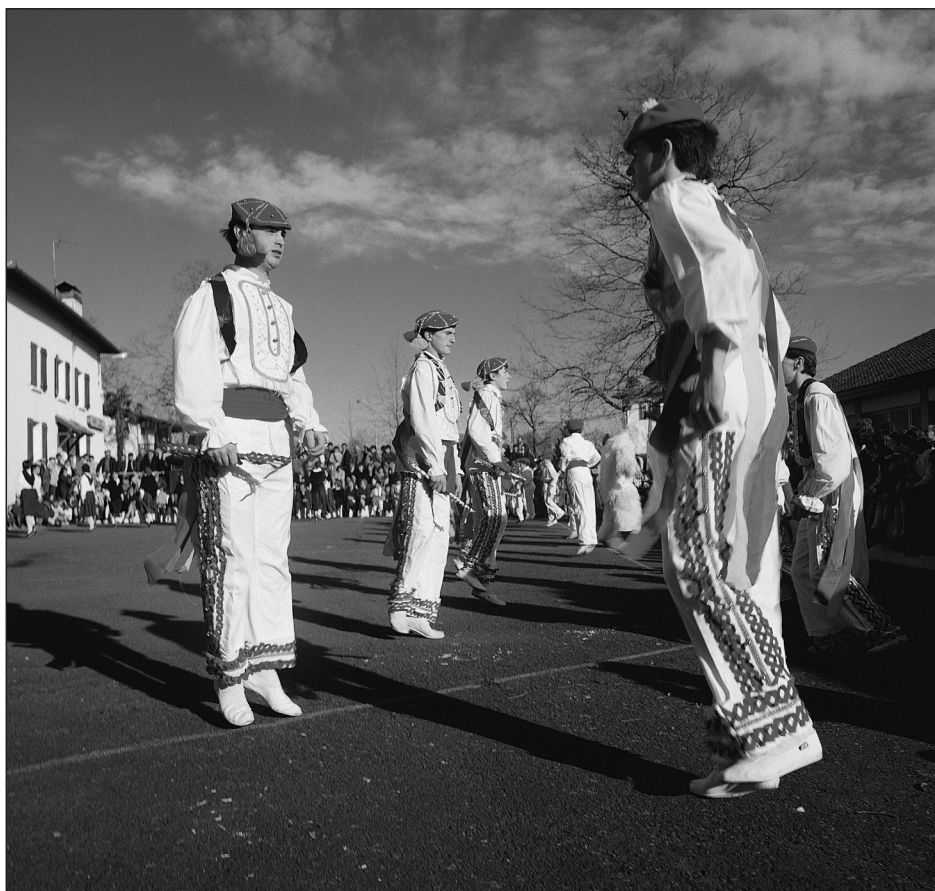
Bolantak/Volantes de Luzaide/Valcarlos. Último Bien de Interés Cultural del patrimonio cultural inmaterial declarado en Navarra (2012).