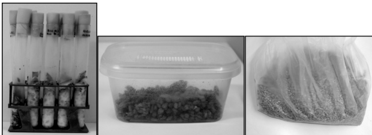
Figura 1. Scale-up da cultura de Bursaphelenchus xylophilus , passando de tubos de ensaio com 5 ml de cevada (esquerda), para caixas com 100 ml de cevada (centro) e finalmente para sacos com 2 l de cevada (direita)

Os registos anteriores deste teste de susceptibilidade referem-se apenas a experiências em pequena escala, num pequeno número de raminhos entre 5 a 10 por experiência (MATSUNAGA & TOGASHI, 2009; OKU et al. , 1989; TOGASHI & MATSUNAGA, 2003). Para possibilitar a execução de um teste de susceptibilidade ao NMP em larga escala foi necessário fazer um scale-up da cultura de nemátodes. Em laboratório, os nemátodes são mantidos em B. cinerea crescido a 25°C em grãos de cevada autoclavados. Inicialmente usaram-se tubos de ensaio com 5 ml de cevada (Figura 1, esquerda), nos quais se deixou o fungo crescer durante 7 dias antes de adicionar uma pequena quantidade de nemátodes (3-4 grãos de cevada de uma cultura prévia). Ao fim de 5 dias todo o fungo tinha sido consumido sendo no entanto a quantidade de nemátodes obtida muito baixa para realizar um ensaio de susceptibilidade em larga escala. Cultivou-se então o fungo em caixas com 100 ml de cevada