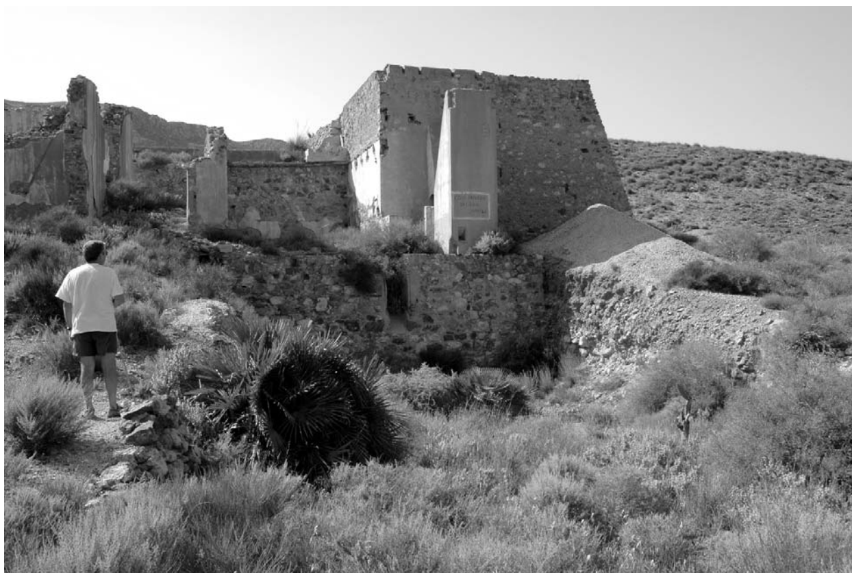
Figura 5. Área en donde se emplazaba la maquinaria de la instalación metalúrgica. En la zona más alta se encontraba la tolva de recepción y la machacadora. A continuación se emplazaba la batería de bocartes y el molino de bolas y finalmente el resto de la maquinaria metalúrgica se encontraba en el gran hueco situado a la derecha de la persona de la imagen.

Para el funcionamiento del proceso se utilizaba la siguiente maquinaria: Un motor marca BATES, de aceite pesado y con 33 caballos de potencia, un generador eléctrico marca ASEA de 11 caballos de potencia y varias bombas eléctricas.