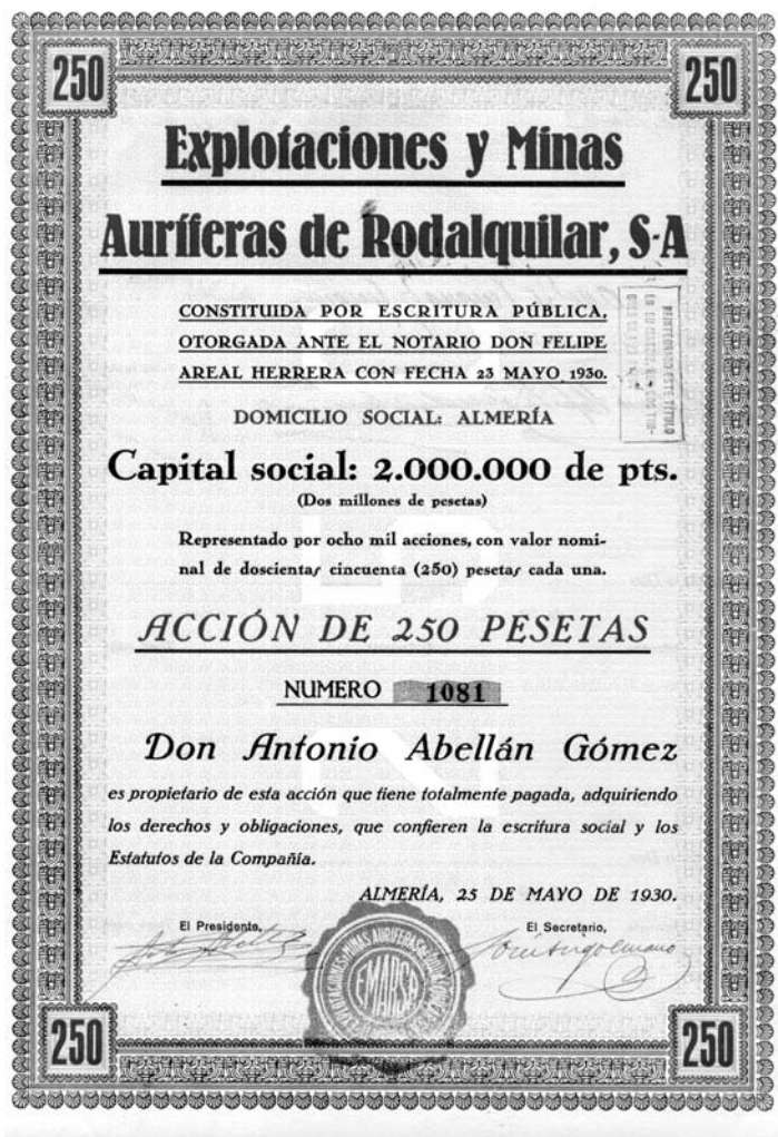
Figura 8. Acción Nominal de la empresa Explotaciones y Minas Auríferas de Rodalquilar.

Antiguos trabajadores mineros de la zona, aun recuerdan que en aquellos momentos se auguraba un magnífico futuro para la nueva compañía aurífera pero finalmente la realidad fue al parecer, que los cambios a