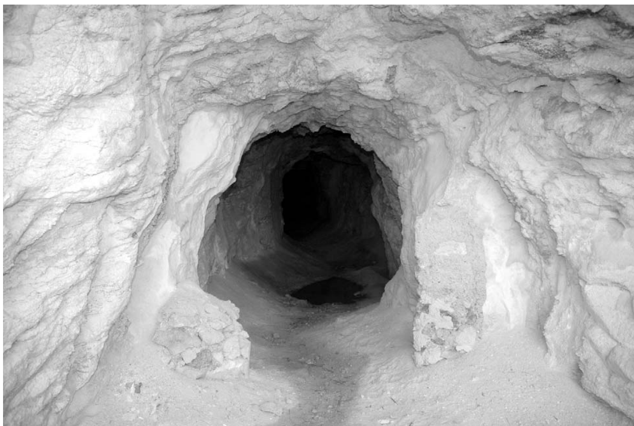
Figura 3. Interior de una de las galerías de la mina "Blanca y Negra". En las paredes se puede intuir el elevado grado de alteración hidrotermal de las rocas.