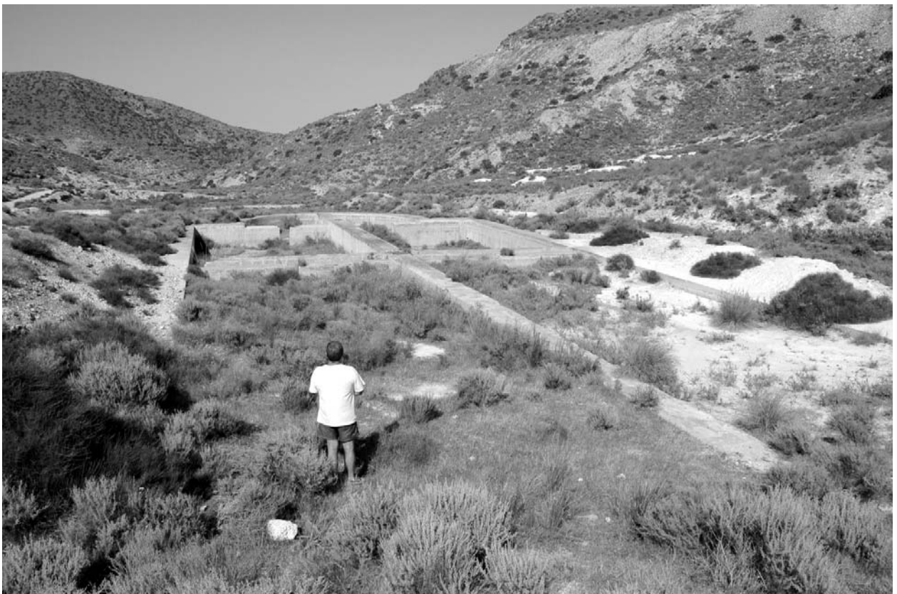
Figura 7. Estado actual de las 6 balsas del sistema hidráulico, dedicadas posiblemente al reciclado del agua utilizada en el proceso metalúrgico. Este era un apartado fundamental debido a la escasez del agua en la zona.