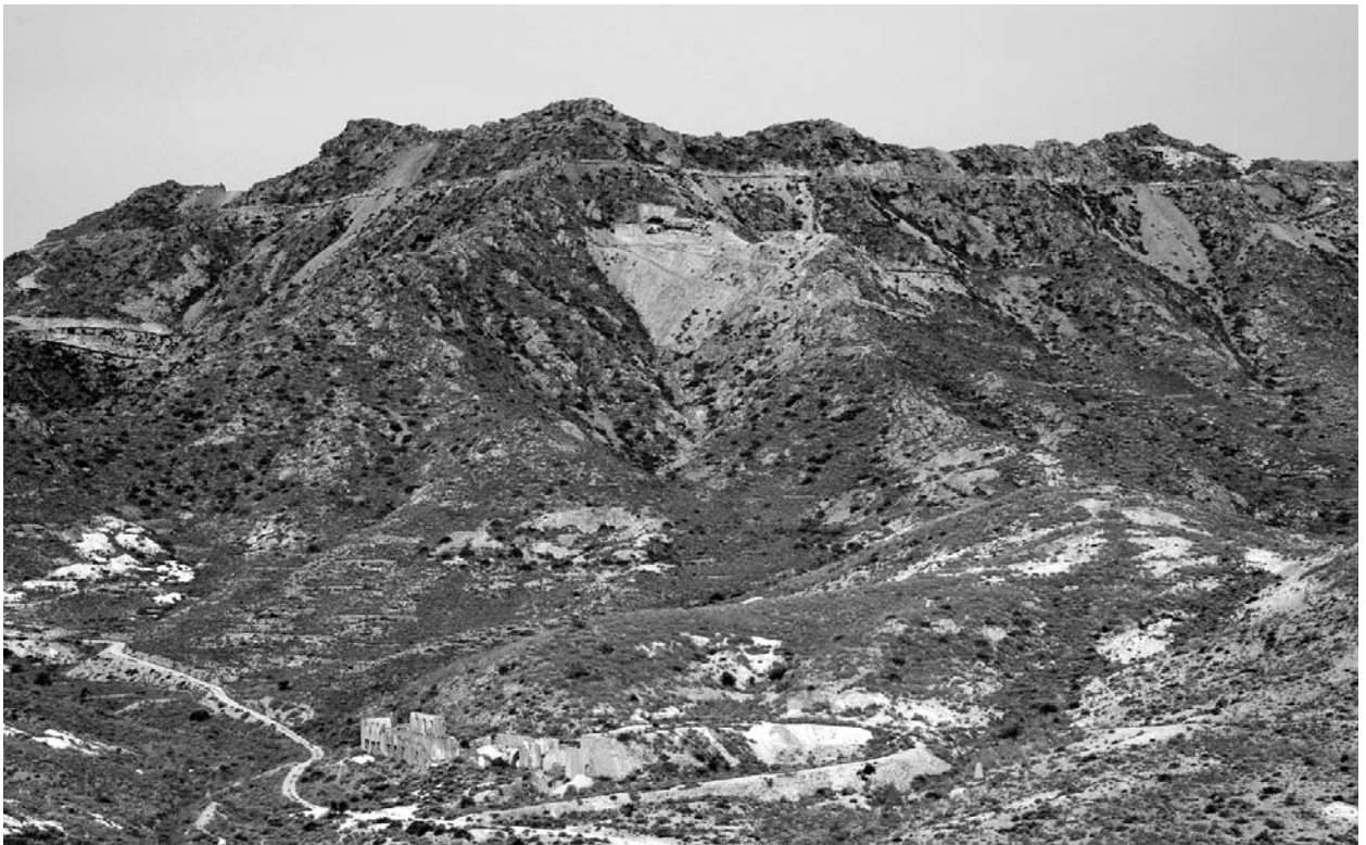
Figura 1. Ruinas de la instalación metalúrgica, propiedad de EMARSA, que fue construida en los terrenos de su mina "California". La instalación está a los pies del cerro del Cinto.

edad Neógena de unos 25 km de largo por unos 5 de ancho, rondando su máxima altura los 500 m. Discurre paralela a la costa del Levante de Almería, comenzando en el faro del Cabo de Gata y llegando a las inmediaciones del faro de Mesa Roldan. Aproximadamente en su centro geográfico se encuentra el pueblo de Rodalquilar.