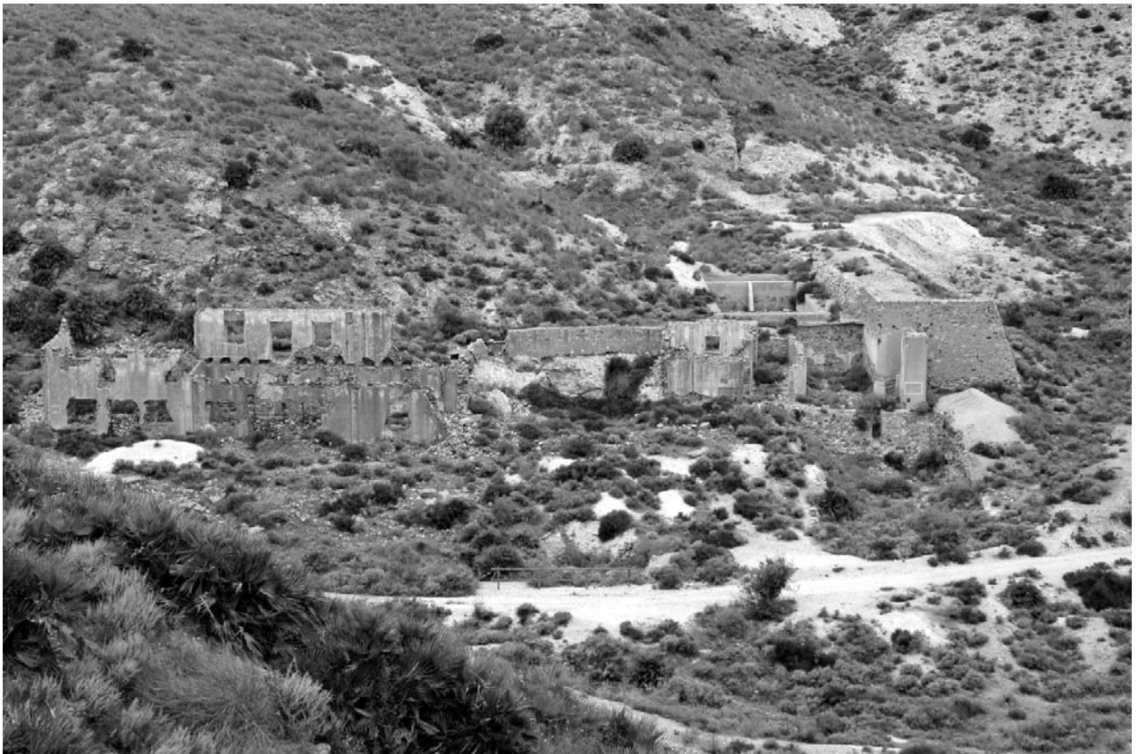
Figura 6. Edificio principal de la instalación metalúrgica propiedad de EMARSA. En la planta baja estaban los talleres, el almacén y la fundición, mientras que en la planta alta estaban las oficinas y los dormitorios.