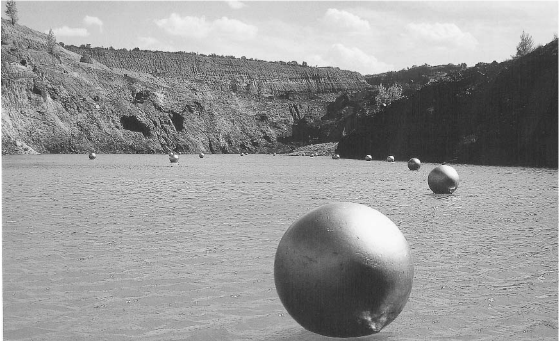
Figura 8. Josep Ginestar. Instalación en la Mina Menerillo, 2005.

de la memoria colectiva, con la valoración del patrimonio natural, cultural o industrial, acercando la práctica artística contemporánea a los ciudadanos, que pasan, de ser meros espectadores, al motivo principal y parte integrante de las intervenciones.