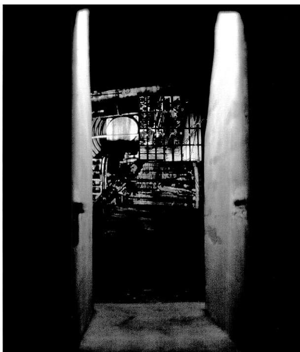
Figura 6. Nexatenaus. Intervención en la nave de vehículos pesados, 2000.