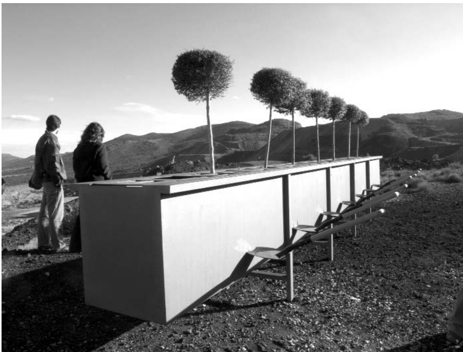
Figura 9. Bodo Ulrich Rau. Escultura en los depósitos de estériles, 2005.

La práctica artística en un escenario industrial como el que nos ocupa, puede emplear distintos for-