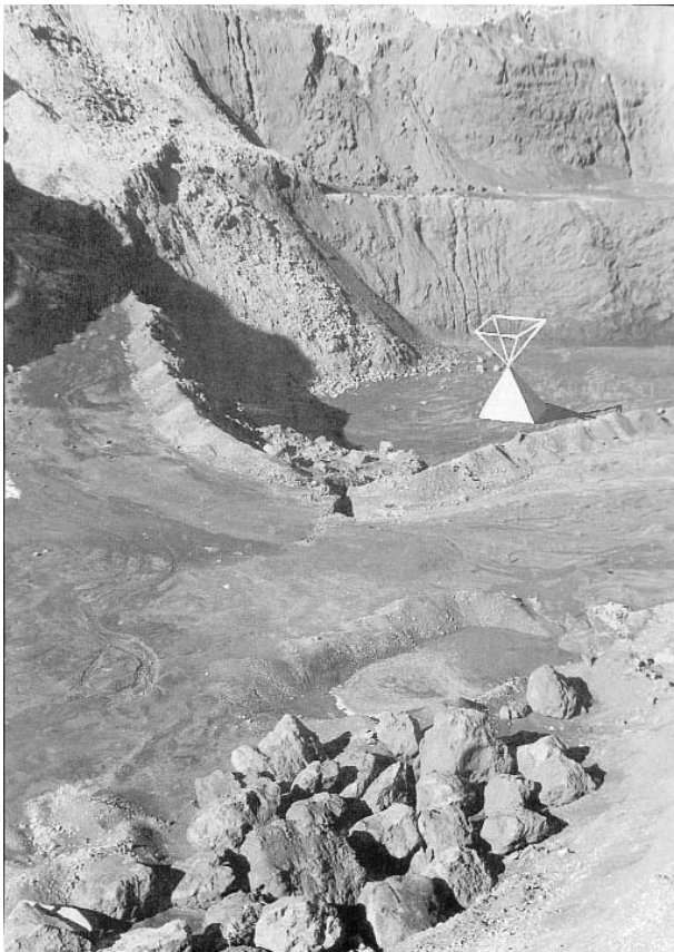
Figura 2. Diego Arribas. Escultura en la Mina Carlota, 1992.

demográfico. La pérdida de significación poblacional y el declive de la actividad económica se sintió especialmente en la localidad de Ojos Negros, en cuyo término se encuentra la mayor parte de la concesión de la explotación minera. La localidad pasó de los 3.000 habitantes, de la primera década del pasado siglo, a los 560 de la actualidad, de los cuales tan sólo 40 viven ahora en el Barrio Minero.