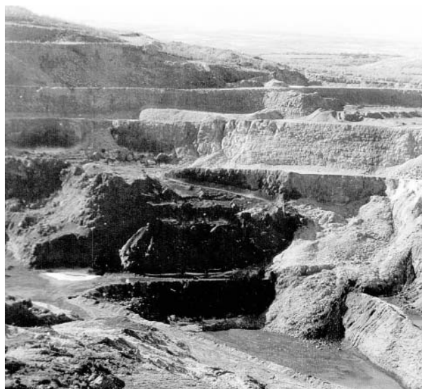
Figura 1. Sierra Menera. Mina Carlota.

Tras el cierre de las minas, las poblaciones de su entorno sufrieron la implacable sangría del descenso