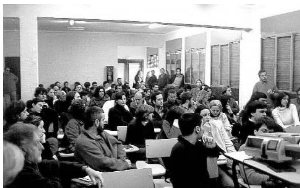
Figura 7. Arte, industria y territorio 1. Debates en las antiguas oficinas de la compañía minera, 2000.