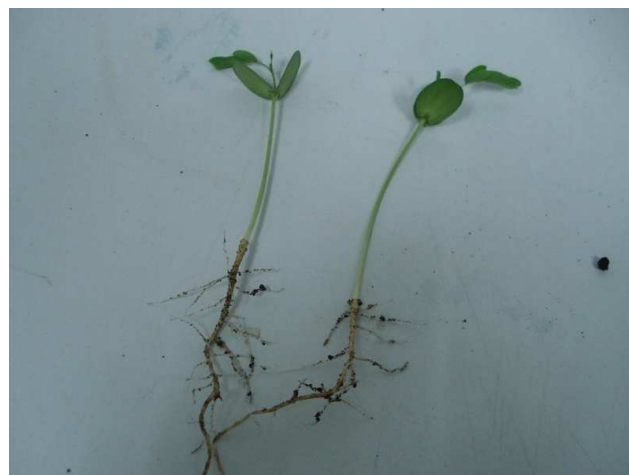
Ilustración 1. Detalle de las plántulas de Leucaena leucocephala (Lam) expuestas a 125 mT a 60 minutos, a los 16 días de la siembra.