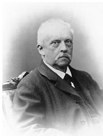
Figura 4. Hermann von Helmholtz.

Este resultado se conoce con el nombre de primer principio de la termodinámica. Von Helmholtz fue convidado a ocupar la cátedra Cavendish de la Universidad de Cambridge; pero siendo poco amigo de cambios, prefirió permanecer en la que ostentaba en Heidelberg. Su rechazo benefició el acceso a ella del joven físico de origen escocés, James Clark Maxwell (1831-1879).