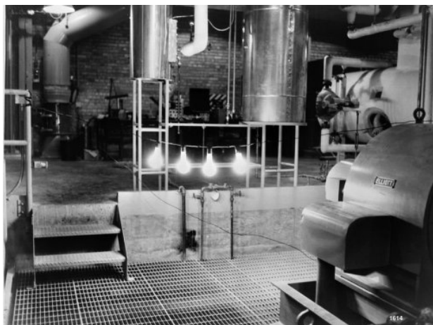
Figura 5. Primeras bombillas que lucen mediante la electricidad que fue generada por un reactor nuclear en Arco.

ellas son del tipo de agua ligera a presión (PWR): Almaraz, Ascó, Vandellós II, Trillo; y dos son del de agua ligera a ebullición (BWR): Santa María de Garoña y Cofrentes.