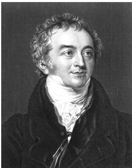
Figura 1. Thomas Young.

En el Crátilo, 7 Platón sostiene que todo objeto tiene el nombre que le es propio, mientras que Hermógenes opina que los nombres son meras convenciones. Sea como fuere, la esencia necesita de nombre para ser requerida. La capacidad para realizar trabajo fue llamada de muchas formas: vis viva , vis mortua , esfuerzo , etc. Sin embargo, solo un nombre refleja adecuadamente esa capacidad: energía. El hombre que la nominó fue un médico y científico integral: Thomas Young (1773-1829, Figura 1). 8