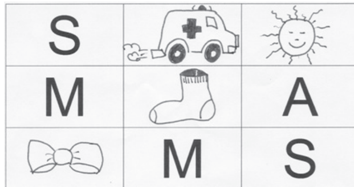
Figura N° 4. Ejemplo de tarjeta de Bingo de Sonidos.

Así, por ejemplo, durante la primera semana sólo incluirá las letras A y S y los dibujos correspondientes. Durante la segunda semana, referirá a las letras A, S y M; la tercera semana, A, M, S y T y así sucesivamente. La actividad se desarrolla de la siguiente manera: a) se le entrega a cada niño una tarjeta de bingo con fichas; b) un niño pasa al frente del aula y extrae de una caja una tarjeta (que puede ser una letra o un dibujo). Si toma una letra, el niño articula el sonido; si extrae un dibujo, pronuncia el sonido inicial; c) todos aquellos niños que tengan en su tarjeta de bingo la letra o el dibujo que se extrajo, colocan una ficha sobre los mismos; d) finalmente, el niño que completa la tarjeta con sus fichas debe gritar "bingo". Yo voto por...: A cada niño se le entrega una serie de carteles con las letras ejercitadas hasta el momento. El docente les dice que va a pronunciar un sonido o decir el nombre de una letra y que ellos deben levantar el cartel con la letra correspondiente. En esta actividad todos los niños regulan sus respuestas, ya que no sólo están atentos al cartel que deben sostener sino también a las respuestas de sus compañeros. Carteles Sonoros: En etapas más avanzadas se emplean pizarras individuales donde el niño manipula las letras aprendidas, impresas en cartones separados, para formar las palabras que dicta el docente (de no más de tres o cuatro fonemas) (Actividades adaptadas de Blachman et al. , 2000) 1 .