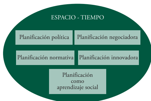
Figura 1. Propuesta de acción desde el ámbito público.

a) Política : debe haber un marco claro de actuaciones y prioridades. En algunas zonas hay que entrar y en otras no, por ejemplo, hay quien piensa que los gobiernos corruptos no deberían ser objeto de ayuda de cooperación. En cualquier caso, se deben establecer prioridades, sobre la base de indicadores específicos, para determinar en qué territorios se deben concentrar esfuerzos e inversión. Esto puede ser más o menos discutible, pero permite orientar políticas y hacer un seguimiento de los resultados. En este marco político hay que involucrar la acción política nacional a tres escalas –de