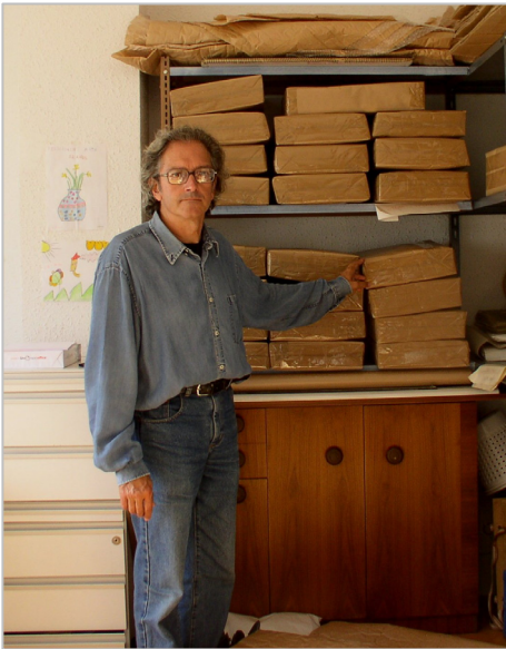
Fig. 3: paquetes de la Centuria VII: Plantas del Herbario VIT 20/09/2007.

recuperación e inclusión en el Herbario VIT como colecciones particulares de los herbarios Prestamero (siglo XVIII) y Lacoizqueta (siglo XIX). Debe mencionarse también, en relación con el trabajo propio del herbario, la ingente y a veces exigente y minuciosa correspondencia mantenida por Pedro, la multiplicidad de información suministrada a quienes la solicitaban en forma de bases de datos y los apoyos documentales proporcionados para numerosas publicaciones (préstamos de pliegos, informaciones puntuales, atención personal a consultas, etc.).