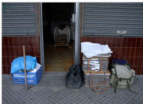
Fig. 2: Las herramientas del oficio. En la puerta de la oficina (17-IV-2007).

Entre los años 1970 y 1975 estudia Ciencias Biológicas en la Universidad de Navarra, obteniendo la licenciatura el 25 de Junio de 1975, tras un notable discurrir académico por las aulas universitarias. Ya por esos años despuntan en su persona las características que más tarde serán percibidas por todos los que le conocieron como los rasgos esenciales de su quehacer en la vida: Una discreta actitud social que bascula siempre entre la ausencia a los actos sociales—nada en él permite suponer que estime como objetivo el éxito social—y unos gustos y ademanes poco comunes expresados con una contundencia y fidelidad permanentes —a sus ideas y a todo lo que lleva dentro como único equipaje—. De ahí su cuidada selección de amistades, con la música de los cantautores del momento, la Ciencia, la Naturaleza y el afán de aprender como únicas motivaciones existenciales. De ahí, también, el profundo impacto que le supuso, en los últimos años de la carrera (Ecología 5º), la figura docente de D. Pedro Montserrat, desencadenada desde la prosa efervescente del maestro, mucho más cálida y rotunda que la que se oficiaba desde las cátedras, y que resultó ser el motor de un auténtico satori o ceremonia de iniciación a la ética propia de la Ciencia, como el mismo Pedro reconocía, años más tarde, no pocas veces.