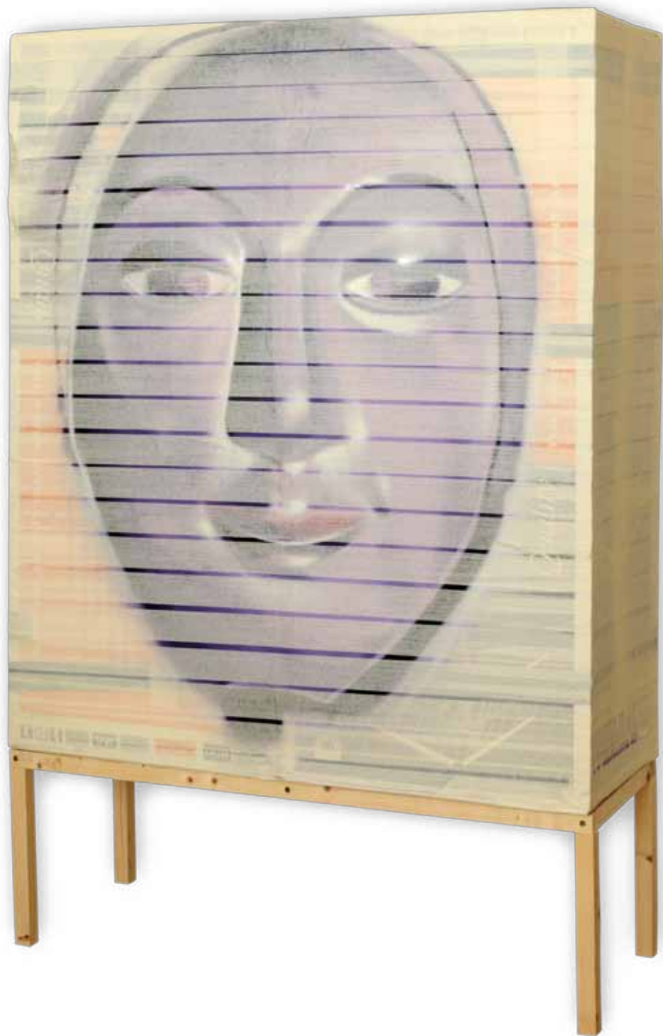
Aparición descodificada , 2010 Matías Mata (Sabotaje al montaje) Técnica mixta Medidas variables