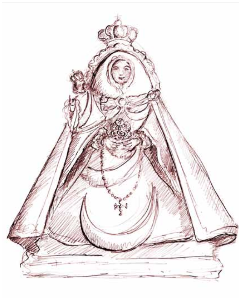
Evocación, 2010 Domingo Cabrera Grafito sobre papel 32,5 x 25 cm