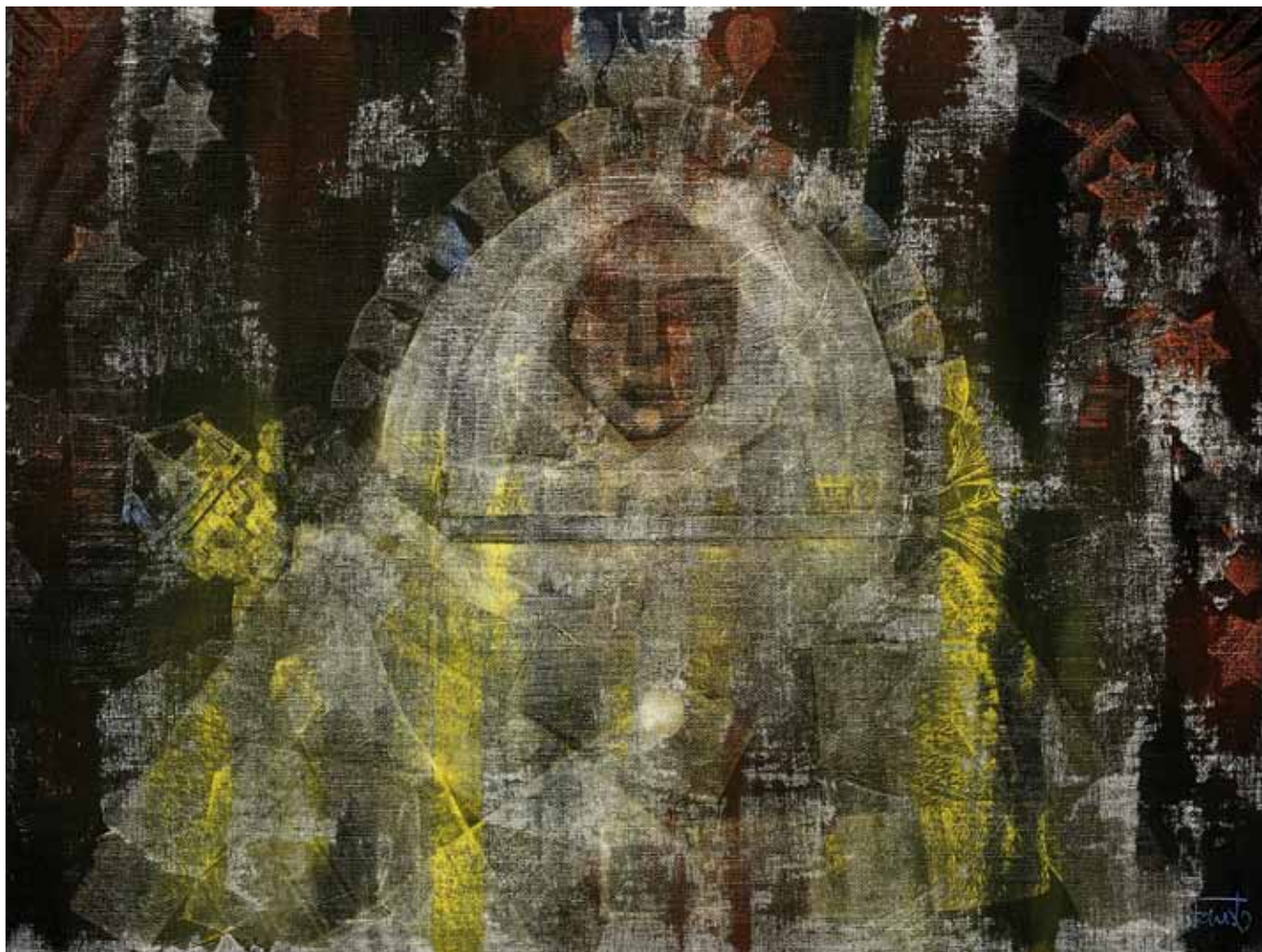
Virgen de las Nieves , 2010

Pedro Fausto Óleo sobre lienzo 54 x 72,5 cm