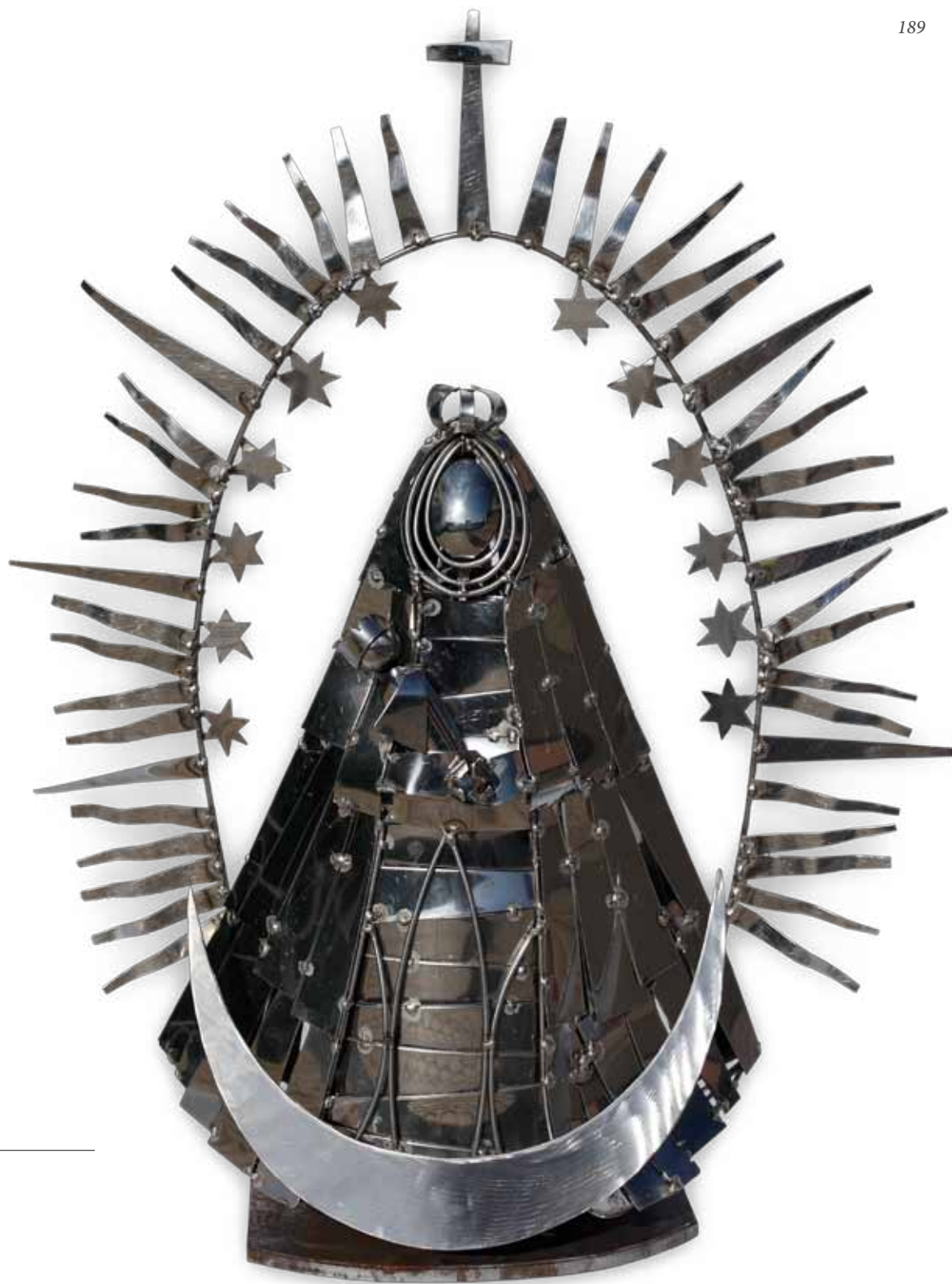
La Virgen eres tú, 2010 Julio Nieto Escultura (acero inoxidable) 82 x 65 x 29 cm