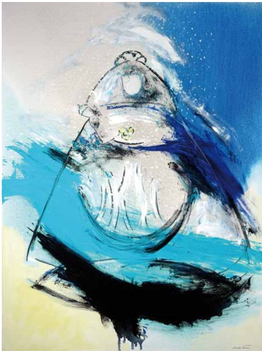
Virgen, 2010 García Álvarez Óleo sobre lienzo 72,5 x 53,5 cm