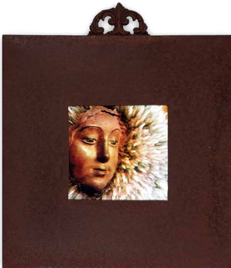
Virgen de las Nieves, 1992 Jorge Lozano Fotografía tratada digitalmente 24 x 25,5 cm