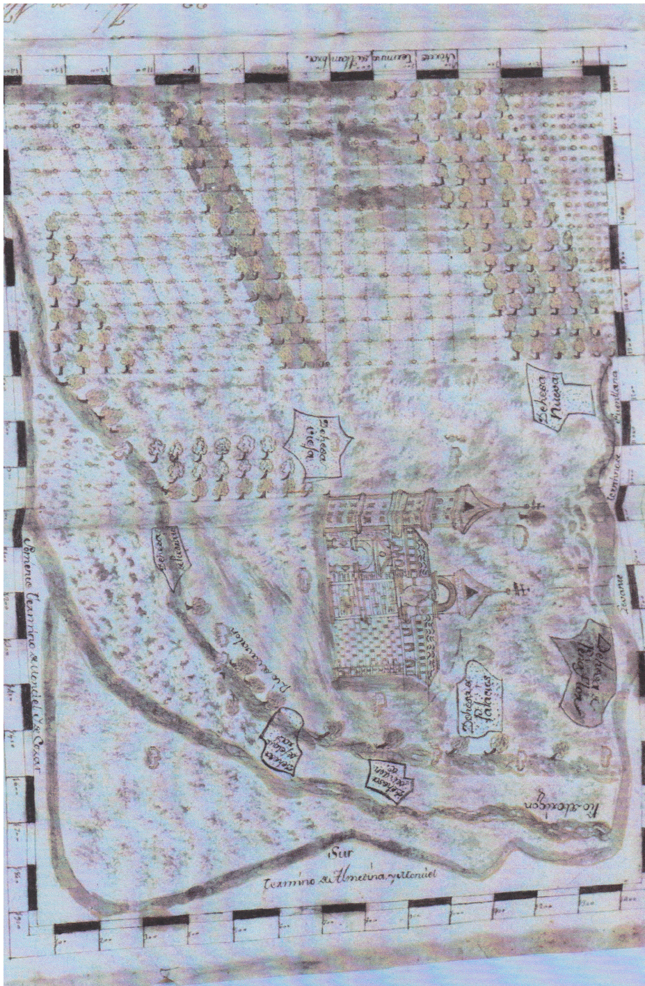
Fig. 1: Plano de Villanueva de los Infantes en el Catastro de Ensenada. Archivo Histórico Provincial de Ciudad Real, Ms, H-700 bis.