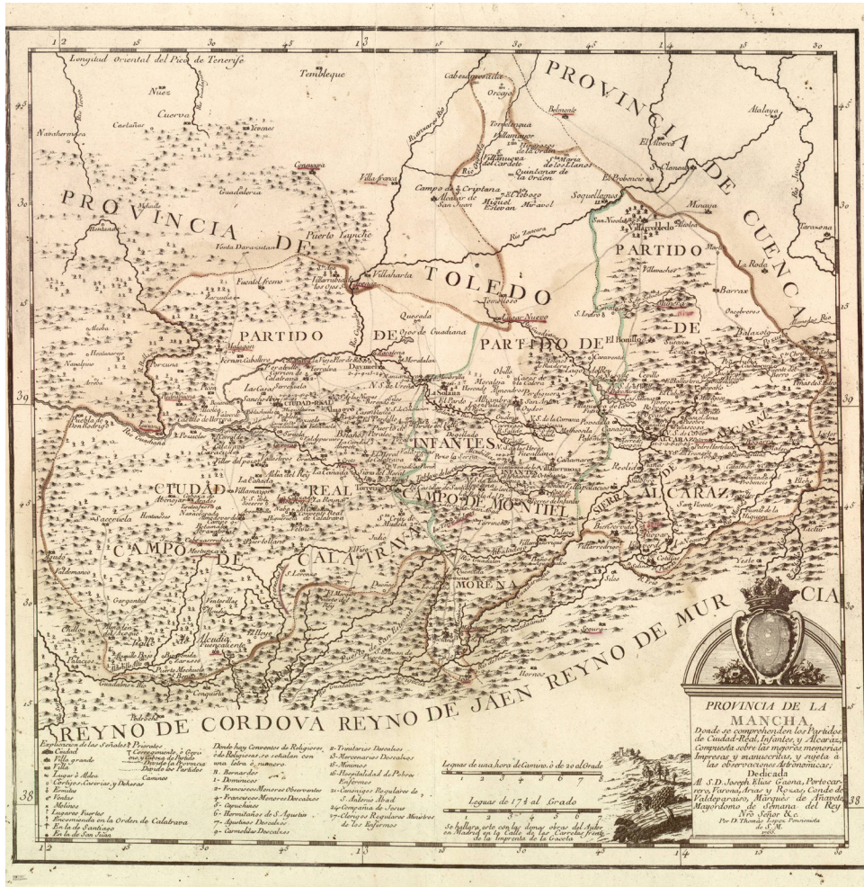
Fig. 2: Mapa de la Provincia de La Mancha, de T. López de Vargas Machuca (1765). Real Academia de la Historia, C/Atlas E, Ia, 7, y C/Atlas E, Ib, 6.