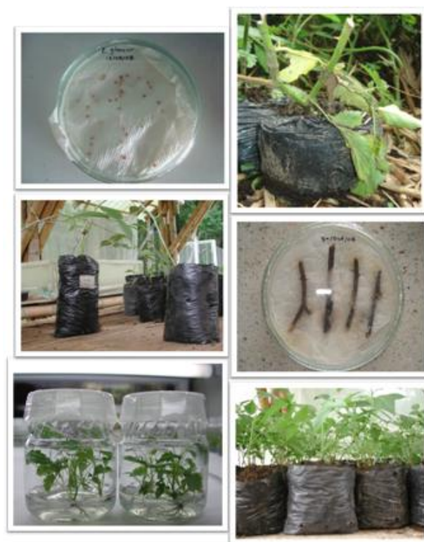
Fig. 1. Métodos de propagación utilizados para la obtención de ápices radiculares A. Semillas B. Estacas C. Acodos D. Estacas con Enraizador E. Cultivo In vitro F. Plántulas en bolsa.

Las raíces producidas por las plantas en bolsa mantenidas en vivero fueron las que presentaron mejor color, mayor tamaño, consistencia, y por consiguiente mayor facilidad a la hora de manipularlas.